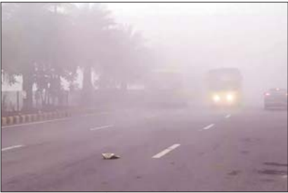
रायपुर 3 जनवरी

कुछ क्षेत्रों में हो सकती है 1 से 2 डिग्री की वृद्धि, बलरामपुर रहा सबसे ठंडा