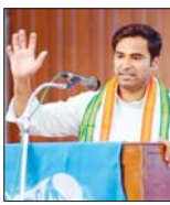
धमतीर-कोरबा और जादलपुर के कार्यक्रम में होंगे शामिल

रायपुर, 3 जनवरी। छत्र संगठन एनएसयूआई के राष्ट्रीय अध्यक्ष वरुण चौधरी दो दिवसीय दौरे पर आने वाले हैं। शनिवार 4 जनवरी को दोपहर 1 बजे रायपुर पहुंचेंगे। स्वामी विवेकानंद विमानतल समेत रायपुर शहर में अलग अलग स्थानों पर कार्यक्रमोंओं द्वारा स्वागत किया जाएगा। रायपुर विमानतल से सीधे धमतीर प्रस्थान करेंगे। शनिवार दोपहर धमतीर में आयोजित सविधान मार्च परदेयता में शामिल होंगे। शाम कोकर में आयोजित मंगल यात्रा में शामिल होंगे। कोरबा से जादलपुर प्रस्थान कर राति विश्राम जादलपुर में ही करेंगे।