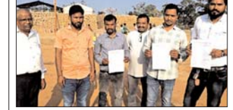
बीजापुर, 1 जनवरी (तट तृतीयसप्त संवाददाता)। बर लिफिट से अधिक खरीदी के बावजूद जिले के धान उत्पाजिन केन्द्रों में धान का उठान ना होने से खरीदी केन्द्रों में धान की खिखि मिलित हो गई है। आसमय में है कि वह केन्द्रों में डिस्टरल हो दू लिखे। भर धान खरने की उगत नही है, इससे परेशान खरीद प्रमायियों ने सीधे कलेक्टर से धान उठव हेतु गुहार लगाने के साथ मिताय भी दी है कि 5 जनवरी तक भर लिफिट के उठान धान का परधान भोग्यता का होने की खिखि मिलित हो गई है। 6 जनवरी से जिले के सभी धान उत्पाजिन केन्द्रों में खरीदी बंद कर दी जाएगी। मिली जानकारी अनुसार 29 डिसेंबर तक जिले के 30 उत्पाजिन केन्द्रों में 4 लाख 37 हजार 737 किलो धान की खरीदी हुई है। जिसमें से महज 51 हजार 850 किलो धान उठाव हुआ है। खरीदक 3 लाख 85 हजार 886 किलो धान का उठाव होना बाकी है। ये उठाव 29 डिसेंबर के है। एसे में 30 और 31 डिसेंबर में खरीदी से शेष मात्रा के अलावा 30 नववरी को खरीदी डिस्टरल में हो रही देरी से धान खरीदी करने वाली समितियों को विचि बत है। मार्केटिंग की नीति के बावजूद एक महिने से ज्यादा होने की वजह से सुखत बढ़ रही है। लामिय समितियों में बर स्टॉक से ज्यादा धान की खरीदी हो चुकी है। समितियों की मांग तो जित में एक ही मिलने से एसे खिखि मिलित हुई है। उठाव के लिए अंतजिजा डीओ और टीओ जारी किया जाता है तो समस्या से डिस्टरला पाया जा सकता है। वैबहेरल उठाव में ही देरी से खरीदी केन्द्रों में धान जाय की खिखि मिलित हुई है, वही कई केन्द्रों में धान खरने की उगत ना होने से खरीदी भी प्रमायित हो रही है, इतना ही नहीं समितियों को सुखत की तिंता भी सता रही है। हालांकि जिला सरकार समिति सच ने ज्ञापन के शिवा प्रकाशन का ध्याकरण जरूर करपा है, लेकिन वसुस्थिति से पूरी तरह वाकिफ करने के पदाधिकारियों ने प्रयाजन का सफ चोवानी भी दी है कि बर स्टॉक से उठर धान उठव को लेकर प्रयाजन कोंड करम नहीं उठाता है। 6 जनवरी से जिले के सभी उत्पाजिन केन्द्रों में खरीदी बंद कर दी जाएगी।