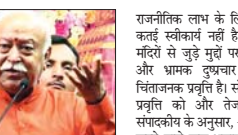
मोहन भागवत की टिप्पणी से उठे विवाद को मुखपत्र 'पांचजन्य' ने शांत करने का किया प्रयास

भूमि कहा गया है, यह भूमि केवल शक्ति ही नहीं, बल्कि सांस्कृतिक, सामाजिक और आध्यात्मिक मूल्यों का जीवंत संदन है। ऐसे में मॉडरों का महत्व दक्षिण ही नहीं, बल्कि सामाजिक और ऐतिहासिक भी है। संपादकीय में कहा गया है कि ऐतिहासिक और आध्यात्मिक मूल्यों को संरक्षित, लेकिन राजनीतिक स्वार्थ से परे - कुछ तत्वों - ने अपनी राजनीतिक को बढ़ावा देना, समुदायों को भ्रुकाना और को बहाना देना और इलाके में 'हिंदू मॉडरों' को बहाना की आड़ में खुद को स्वैरधर हिंदू विचारक के रूप में पेश करना शुरू कर दिया है। इसमें कहा गया है, 'मॉडरों की खोज को समरसमोचन तरीके से प्रचार करना शायद मीडिया के लिए भी एक जलन बन गया है और यह एक प्रकार का महासात है।