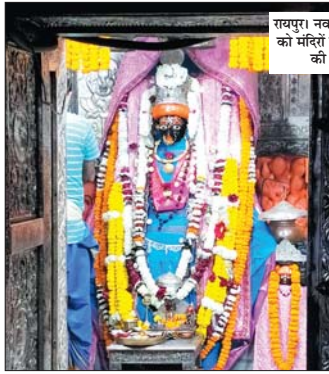
रायपुर। नववर्ष के पहले दिन शहर को भक्ति में दर्शन के लिए लोगों की भीड़ लगी रही।

हाथी शावक की मौत रायगढ़, 1 जनवरी। जिले में लगातार हाथियों का आना-जाना लाल रहता है. इस दौरान जंगल में बने टापू क्षेत्र के दलदल में फरसे से एक हाथी के शावक की मौत हो गई. इसके बाद इसकी वन विभाग की टीम को दी गई. सूचना मिलते ही वन विभाग की टीम मौके पर पहुंची और जांच में जुट गई. माथवा शराबोचय वन विभाग के पानी खाते गाय की है. मिली जानकारी के अनुसार, शराबोचय वन परिक्षेत्र में लगभग 38 हाथियों के दल विचरकर लाते हैं. विचरण करते-करते हाथी का शावक जंगल में बने टापू क्षेत्र के दलदल में फंस गया और उसकी मौत हो गई. आपसमें के क्षेत्र में बंदव फेलत गई. तब इसकी जानकारी ग्रामीणों को हुई. इसके बाद ग्रामीणों ने इसकी वन विभाग की टीम को दी गई. सूचना मिलते ही वन विभाग की टीम मौके पर पहुंची और जांच में जुट गई. जांच में पता चलत कि, शावक हाथी का शव 2 से 3 दिन पुराना है. वहीं कुछ पिछले दिनों में छत्तीसगढ़ के नगरी में एक हाथी के बच्चे ने एक 3 साल के बच्चे की जान ले ली. वनचल बंध के अस्थिभंग के विचरणों में एक हाथी के बच्चे ने घर में कुकरक मिला और बच्चे को घुसकर मार डाला. घटना की जानकारी मिलते ही वन विभाग की टीम मौके पर पहुंची और उसे खड़े-दिया. पीछड़ा संभव कारण बताया कि, पाईड में बो आनी पलटी और 3 साल की बच्ची के साथ सो रहा था।