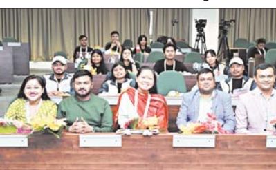
किरण। उन्होंने कहा, भारत की ताकत उसकी विविधता में है, और युवा संगम जैसे कार्यक्रम युवा मनों को हमारे देश की समृद्ध विरासत और संस्कृति को समझने और अपनाने का एक अद्भुत माध्यम करते हैं।

राजपुर, 27 दिसंबर। भारतीय प्रबंध संस्थान (भा.प्र.सं.) राजपुर, को प्रिंजिंटोडिबिजनेसआनोसर्स के लिए जाना जाता है, ने शिक्षा मंत्रालय की प्रमुख हस्तगत, एक भारत श्रेष्ठ भारत पहल के तहत युवा संगम फेज-5 में हिस्सा लेने आए असम विश्वविद्यालय, सिलचर ने 45 छात्रों और 5 संस्कृतिका का स्वागत किया।