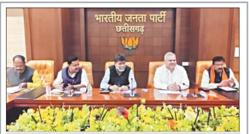
राजपुर 27 दिसंबर। भाजपा संगठन के चुनाव को लेकर भाजपा मुख्यालय कुशाभाऊ ठाकरे परिसर में बैठक हुई।

के लिये बुलवाया गया। इन अस्थास्थिों का जिस दिन परीक्षण होगा था उस दिन उनसे तबतयत खराब होने आदि का बहाना बना कर आवेदन लिखा गया तथा सभी को एक आदेशित दिन बुलवाया गया।