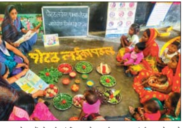
पोडू लर्का पहल अंतर्गत सबसे पहले सवोचिक कुषोपित 241 आंगनाडि केन्द्रों का चयन किया गया। जिसमें 323 एलएएम (गर्भरि तीव्र लिला प्रशासन ने युनिसेफ और एवीस पहल के साथ साझेदारी में पाँड

वर्षे को किस समय खिलाणा चाहिए संसंध में अभिभावकों को जानकारी देना चाहिए। परामर्श के हमी के कारण कई लर्का पहल को शुरूआत की गई। युनिसेफ छत्तीसगढ़ पाँड लर्का पहल कार्यक्रम तकनीकी और प्रशिक्षण भागीदार रहा है।