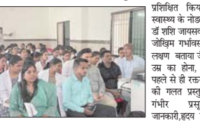
प्रशिक्षित किया जायतला में उच्च जोखिम गर्भवती स्त्री के सुरक्षित प्रसव तथा प्रसव से पूर्व एवं पश्चात् किए जाने वाले देखभाल को लेकर जिला अस्पताल बलौदाबाजार के सभाकक्ष में आयुष्मान् स्वास्थ्य मंत्रियों के प्रमुख सामुदायिक स्वास्थ्य अधिकारी तथा ग्रामीण स्वास्थ्य सरोजनों के प्रशिक्षण बाबत एक दिवसीय कार्यशाला का आयोजनशनिवार को किया गया...