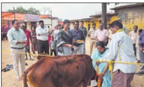
कार्यक्रम हर्षोद्धार के साथ आरंभ किया जा चुका है। जिसके अंतर्गत स्थानीय जिले के विभिन्न विभागों के कर्मियों को गौ पूजन का कार्यक्रम आयोजित किया जा रहा है...