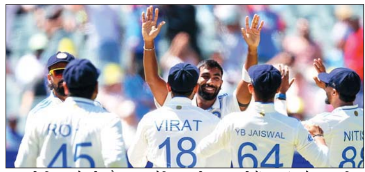
अनुभवी विराट कोहली और कप्तान रोहित शर्मा की बल्लेबाजी से हुई। यह दोनों बल्लेबाज ऑस्ट्रेलिया के गेंदबाजों का सामना करने में विफल रहे। गेंदबाजी में जसप्रीत

भारतीय वायुसेना की पयूचर वारफेयर तैयारी नई दिल्ली, 8 दिसंबर। भारतीय वायुसेना की पश्चिमी वायु कमान ने राजधानी दिल्ली में दो दिवसीय कमांडर्स कॉन्फ्रेंस का आयोजन किया। इस सम्मेलन की अध्यक्षता वायुसेना प्रमुख एयर चीफ मार्शल एपी सिंह ने की। इस वर्ष इस कार्यक्रम की थीम भारतीय वायुसेना-सशक्त, सक्षम, आत्मनिर्भर- पर केंद्रित थी। इस सम्मेलन में वायुसेना प्रमुख ने भी शिरकत की। इस दौरान उन्होंने कमांडरों के साथ बातचीत की, जिसमें उन्होंने भविष्य के बहु-डोमेन युद्ध की चुनौतियों का सामना करने के लिए उनकी तैयारी पर जोर दिया। इसके साथ ही वायु सेना प्रमुख ने प्रशिक्षण, योजना, सुरक्षा और नए उपकरणों के शीर्ष संचालन पर विशेष ध्यान देने की आवश्यकता पर बत दिया।