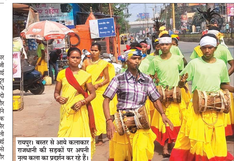
रायपुर। बस्तर से आये कलाकार राजधानी की सड़कों पर अपनी नृत्य कला का प्रदर्शन कर रहे हैं।

मुंबई। प्रधानमंत्री नरेंद्र मोदी महाराष्ट्र में 20 नवंबर को होने वाले विधानसभा चुनावों के मद्देनजर 8 से 14 नवंबर राज्य में पार्टी के प्रचार के लिए कई रैलियां करेंगे। बताया जा रहा है कि प्रधानमंत्री मोदी राज्य में 8 से 14 नवंबर के बीच करीब 11 रैलियों को संबोधित करेंगे। महाराष्ट्र भाजपा प्रमुख चंद्रशेखर बावनकुले ने कहा कि पीएम मोदी के 8 नवंबर को धुले और नासिक, 9 नवंबर को अकोला और नांदेड़, 12 नवंबर को चंद्रपुर, चिमूर, सोलापुर व पुणे और 14 नवंबर को संभाजीनगर, नवी मुंबई और मुंबई में चुनावी सभाओं को संबोधित करने की उम्मीद है। इसके अलावा गृह मंत्री अमित शाह भी राज्य में चुनाव से पहले करीब 20 रैलियों को संबोधित करेंगे।