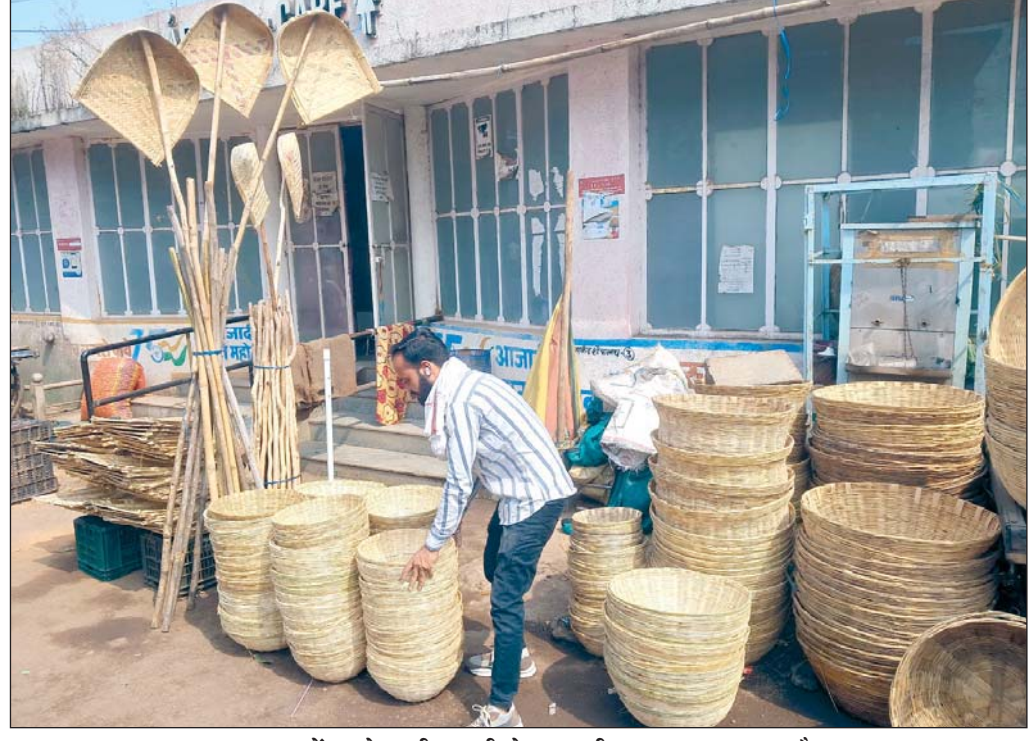
रायपुर, 3 नवम्बर। छठ पूजा में लगने वाली सामग्री से राजधानी का बाजार सज गया है।