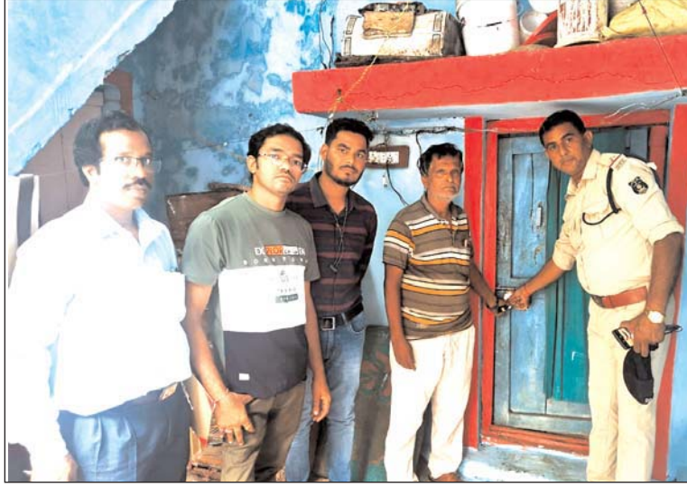
तरुण छत्तीसगढ़ संवाददाता

गरियाबंद, 2 नवंबर। जिले में झोलाछाप डॉक्टरों के खिलाफ स्वास्थ्य विभाग ने बड़ी कार्रवाई की है। स्वास्थ्य विभाग के संयुक्त टीम ने बुधवार को फिंगेश्वर ब्लॉक के कई गांवों छापेमारी कार्यवाही कर दो अवैध क्लिनिक को सील किया है साथ ही दो संचालक को कारण बताओ नोटिस जारी किया है। छापेमारी के दौरान ये सभी क्लिनिक नियम विरुद्ध संचालित पाए गए। इस दौरान टीम ने यहां से बड़ी मात्रा में दर्द के इंजेक्शन, एक्सपायरी दवाइयां, प्रेगनेंसी कीट, अर्बोसॉन कीट, एंटीबायोटिक भी बरामद किए हैं।