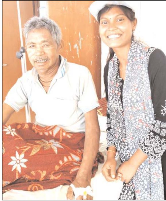
पथलगांव, 2 नवंबर। हॉस्पिटल में भर्ती मरीजों को यह नही मालूम