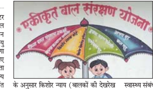
बच्चों की शिक्षा, पोषण और स्वास्थ्य संबंधी आवश्यकताओं को पूरा करने के लिए...