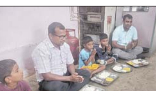
निरीक्षण प्रोग्राम के अंतर्गत आयोजित किया गया। प्रत्येक संस्था में आदिवासी बालकों के अलावा...

एसडीएम ने आदिवासी बालक छात्रावास खट्टी और आदिवासी बालक आश्रम परसदा का किया निरीक्षण।