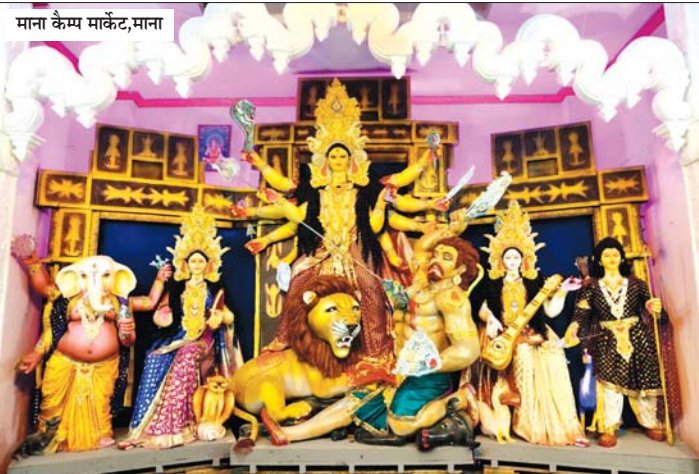
माना कैम्य मार्केट, माना

के लिए एहतियाती कदम उठाने शुरू कर दिए हैं। इससे पहले जयराम रमेश ने एक्स पर लिखा कि लोक सभा नतीजों की तरह हरियाणा में भी चुनावी हराओं को जान-बूझकर चुनाव आयोग की वेकवहाट पर धीमे धीमे शेरार किया जा रहा है। क्या भाजपा प्रशासन पर दबाव बनाने की चेष्टा कर रही है? कांग्रेस नेता पवन खेड़ा ने कहा कि चुनाव आयोग के आंकड़ों के अनुसार गिनती किए गए राउंड की वास्तविक संख्या और टैलीग्राफ पर दिखाए जा रहे राउंड की संख्या में अंतर है। उन्होंने कहा कि इसी डेटा पीछे चल रहा है, वे अभी भी चौथा या पांचवां पाया गया डेटा दिखा रहे हैं जबकि 11 राउंड की गिनती हो चुकी है। हमारे महासचिव संचार ने चुनाव आयोग को डाटाई कर पूछा है। डेटा के प्रदर्शन और अपलोडिंग में देरी करके स्थायी प्रशासन पर दबाव बनाने की कोशिश कर रहे हैं। जम्मू-कश्मीर में आपको हर राउंड की गिनती के साथ लाइव डेटा मिल रहा है लेकिन हरियाणा में ऐसा नहीं है। कांग्रेस को राजस्थान सांसद रेणुका चौधरी ने कहा कि हमें इसके बारे में पता था और ऐसा होना ही था।