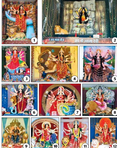
रायपुर, 8 अक्टूबर। 1. हरिदा नगर कुरुद, 2. नया बाजार चौक कुरुद, 3. धोनी पाप कुरुद, 4. गंधी चौक कुरुद, 5. कार्गिल चौक कुरुद, 6. थाना चौक कुरुद, 7. सूर्य मण्डला चौक कुरुद, 8. पुरानी कृषि मंडी कुरुद, 9. बनरा चौक कुरुद, 10. पुराना बाजार चौक कुरुद, 11. संजय नगर कुरुद, 12. सरोजनी चौक कुरुद।