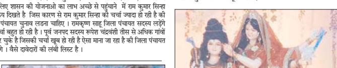
कवर्धा, 5 अक्टूबर। नव दुर्गाव्रत समिति गौरी-गौरा चौक नेऊरगांवकला में मां दुर्गा की मूर्ति विराजित की गई। अंतिम प्रकाश प्रदान ने बताया की पांच वर्षों से मां दुर्गा की मूर्ति नवरात्रि में विराजित करते हैं और मां दुर्गा मनोकामना पूरी करती है।