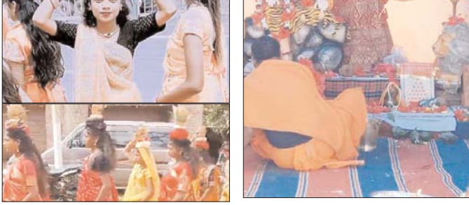
कवर्धा। चिल्पी घाटी में महिलाओं ने निकाली कलश यात्रा