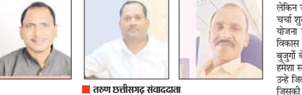
तृणघटीसगढ़ संवाददाता कवर्धा, 5 अक्टूबर। जिला पंचायत सदस्य चुनाव की तारीख अभी नहीं आई है