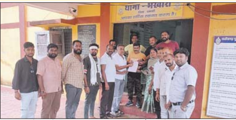
बदरसपुर गांधी एवं सोनिया गांधी के चरित्र के ऊपर अमद्र टिप्पणी कर गुप में पोस्ट कर दिया गया है गुप में एक टिप्पणी का प्रयास किया जा रहा है...