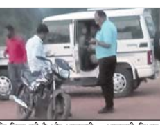
जनापसंपर्क विभाग के माध्यम से अवैध शराब की बिक्री जारी करने के हिसाबी जारी करने से नहीं चुकते, क्योंकि सारे तमाम शराब को फिर और मदक द्रव्यों के अवैध कारोबार से जुड़े लोगों को...