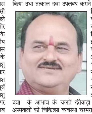
दवा के आभाव के चलते दत्तेवाड़ा जिले में पशु अस्पतालों की चिकित्सा व्यवस्था चरमरा गई है जिसके