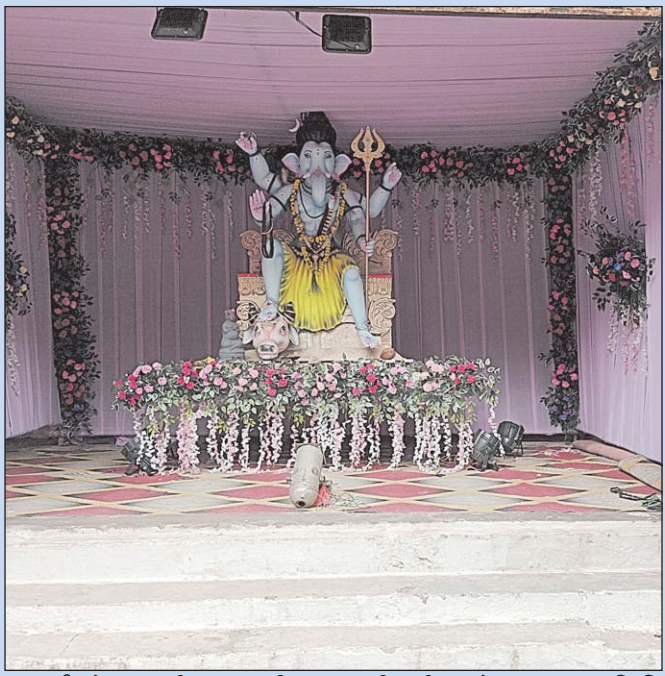
कवर्धा में ब्रह्मलीन स्वामी करपात्री जी गणेश पूजा समिति करपात्री चौक कवर्धा में गणेश जी की प्रतिमा विराजित।