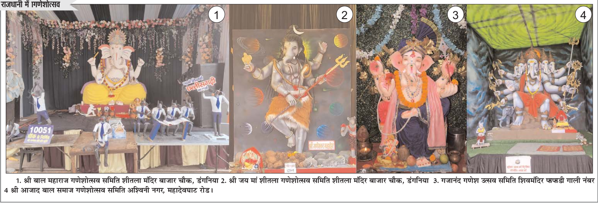
1. श्री बाल महाराज गणेशोत्सव समिति शीतला मंदिर बाजार चौक, डंगनिया 2. श्री जय मां शीतला गणेशोत्सव समिति शीतला मंदिर बाजार चौक, डंगनिया 3. गजानंद गणेश उत्सव समिति शिवमंदिर फाफडी गाली नंबर 4 श्री आजाद बाल समाज गणेशोत्सव समिति अश्विनी नगर, महादेवघाट रोड।