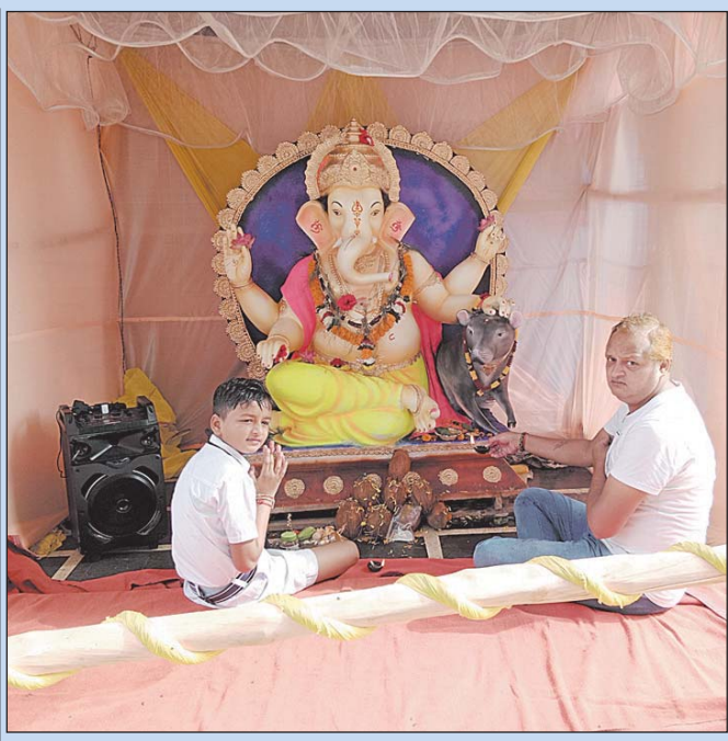
कवधा। वार्ड 12 में श्री गणेश भगवान जी की मूर्ति विराजित।