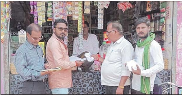
स्वच्छता का कोई विकल्प नहीं है। इसी उद्देश्य के साथ के साथ शपथ कराया जा रही है।