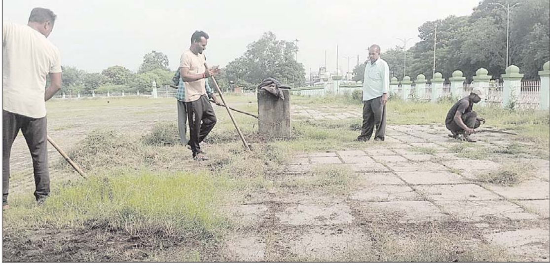
कहीं भी गंदगी न पाई जाये इत्यादि पर ध्यान देना है। कई सुलभ शौचालय के स्वास्थ्य कर्मचारियों से जिम्मेदारी भी सबको लेनी होगी।

भिलाई, 12 सितंबर। नगर पालिक निगम भिलाई में स्वच्छता ही सेवा की शुरूआत 14 सितंबर से होने वाली था, जो अब 17 सितंबर से शुरू होगी एवं 2 अक्टूबर को इसका समापन होगा। साथ ही स्वच्छता सर्वेक्षण की टीम आने वाली है उसको देखते हुए नगर निगम के अधिकारी कर्मचारी सभी जोन में अलर्ट मोड में काम कर रहे हैं। आयुक्त देवेश कुमार ध्रुव ने सभी जोन आयुक्त एवं स्वास्थ्य विभाग के अधिकारी कर्मचारियों को निर्देशित किये हैं कि किसी भी प्रकार की लापरवाही बर्दाश नहीं होगी। सुबह 6 बजे से सभी जोन फील्ड में नजर आना चाहिए, मैं कहीं भी जाकर औचक निरीक्षण कर सकता हूँ। लापरवाही पाये जाने पर संबंधित अधिकारी-कर्मचारी के विरुद्ध तत्काल कार्यवाही की जावेगी। सफाई नगर निगम भिलाई की पहली प्राथमिकता है। जिसमें प्रमुख रूप से सुलभ शौचालयों का साफ-सफाई, पानी की पर्याप्त व्यवस्था, नालों एवं वास बेसिन के आस-पास