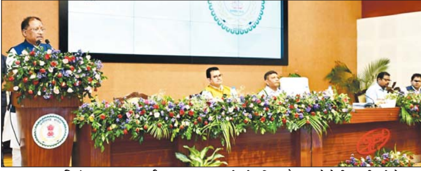
रायपुर, 12 सितंबर ■ तरुण छत्तीसगढ़

योजनाओं के क्रियान्वयन में देरी पर बरसे, सीमांकन के लिए जनता परेशान क्यों हो रही है?