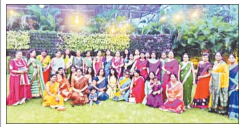
रायपुर 21 अगस्त। श्री साई दर्शन आवासीय समिति जोरा, रायपुर के द्वारा सावन संयम का आयोजन किया गया। कॉलोनी की महिला मंडली ने बह-चढ़ के आयोजन में हिस्सा लिया तथा सभी के सहयोग एवं भावपूर्ण उपस्थिति से यह कार्यक्रम सफल रहा। भक्तिभाव से सरोवरां इस कार्यक्रम के आयोजन एवं संचालन में महिला मंडली ने अहम भूमिका अदा की।

यह है पूरी घटना तेलीबांधा थाने के पास स्थित कंस्ट्रक्शन कंपनी पीआरए ग्रुप के ऑफिस के बाहर 13