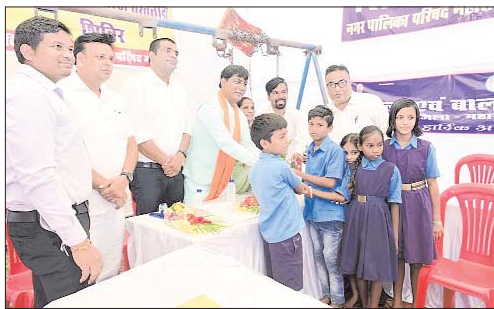
शिविर में राशन कार्ड, प्रधानमंत्री आवास निर्माण, पंचजन, पंचजन विभाग, विद्युत विभाग से संबंधित आवेदनों के अलावा शिविर में जन्म-मृत्यु, शहरी आजीविका मिशन, सार्वजनिक कल्याण, महिला बाल विकास, भवन अनुज्ञा, सामाजिक पेंशन, आयुष्मान कार्ड, जाति प्रमाण आदि से संबंधित आवेदन प्राप्त हुए।