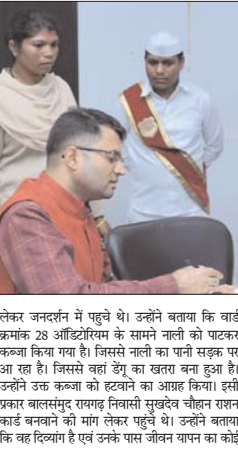
कलेक्टर जनदर्शन में पहुंचे थे। उन्होंने बताया कि वार्ड क्रमांक 28 ऑस्ट्रेलिया के सामने नाली को सड़कर कब्जा किया गया है। जिससे नाली का पानी पटक कर आ रहा है। जिससे बच्चे डेंगू का खतरा बना हुआ है। उन्होंने उक्त कब्जा को हटाने का आग्रह किया। इसी प्रकार बालसमुंद्र राजगढ़ निवासी सुखदेव चौहान राशन कार्ड बनवाने की मांग लेकर पहुंचे थे। उन्होंने बताया कि वह दिव्यांग है एवं उक्त राशन जोवन वगैरे का कोई

राजगढ़, 7 अगस्त। जनसामान्य की समस्याओं के निराकरण के लिए प्राथम जनदर्शन में जाते हैं से लोग पहुंचे थे। उन्होंने कलेक्टर श्री कलकिंश्या गोयल से अपनी समस्याओं और मांगों से संबंधित आवेदन सौंपे। जिस पर कलेक्टर श्री गोयल ने उपस्थित संबंधित अधिकारियों को आवेदनों का जनदर्शन में ही निराकरण कर अवगत कराने में साथ ही शेष आवेदनों का अतिशय निगरण करने के निर्देश दिए।