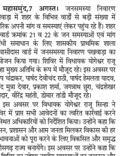
महासमुंद्र, 7 अगस्त। जनसमस्या निवारण पखवाड़ा में शहर के विभिन्न वार्डों से बड़ी संख्या में नागरिक अपनी मांग व समस्याएं लेकर पहुंच रहे हैं। शहर के वार्ड क्रमांक 21 व 22 के जन समस्याओं एवं मांगों से संबंधित समाधान के लिए शासकीय प्राथमिक शाला गुरुश्रीवास वार्डों में जनसमस्या निवारण पखवाड़ा का आयोजन किया गया।