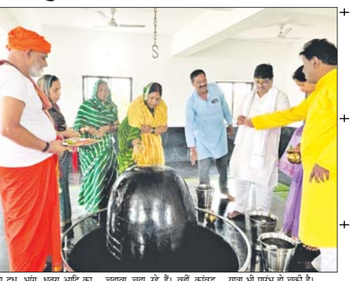
कच्चा दूध, भांग, धतूरा आदि का चढ़ावा चढ़ा रहे हैं। वहीं कांवड़ यात्रा भी प्रारंभ हो चुकी है।