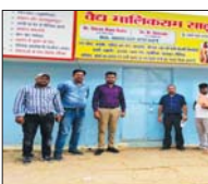
बिलासपुर, 22 जुलाई