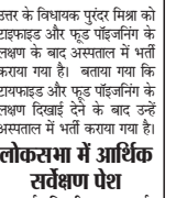
लोकतंत्र में आर्थिक सर्वेक्षण पेश