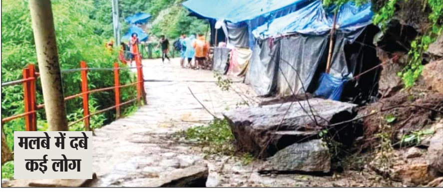
मलबे में दबे कई लोग

अंबिकापुर, 21 जुलाई। छत्तीसगढ़ के अंबिकापुर-रायगढ़ मुख्यमार्ग पर शनिवार देर शाम तेज रफ्तार बाइक ड्रिवाइडर के पथरों से टकरा गई। जिससे बाइक सवार दोनों युवक उखलकर सड़क पर जा गिरा। गंभीर हालत में अस्पताल ले जाते समय दोनों की मौत हो गई। वहीं, नेशनल हाइवे-343 पर परसा के पास दो बाइकों में भिड़ंत हो गई। हादसे में एक युवक की मौत हो गई, जबकि दूसरा गंभीर रूप से घायल है। जानकारी के मुताबिक, बाइक में सवार दो युवक सीतापुर से अंबिकापुर की ओर आ रहे थे। काराबेल पुल के पास तेज रफ्तार बाइक अनियंत्रित होकर सड़क के ड्रिवाइडर पथरों से टकराते हुए उखल गई।