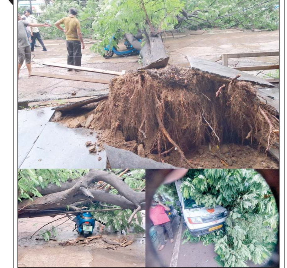
रायपुर, 21 जुलाई। राजीव गांधी चौक के पास आज एक बड़ा पेड़ जड़ से उखड़कर कार व मोपेड पर गिर गया। गनीमत है जनहानि नहीं हुई है।