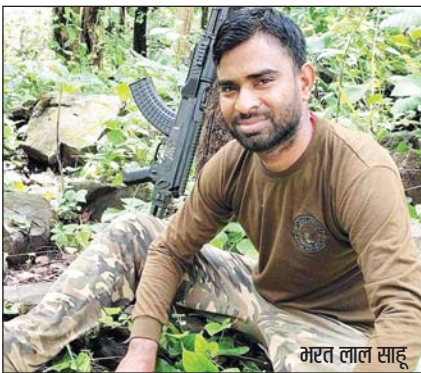
बीजापुर, 18 जुलाई ■ तरुण छत्तीसगढ़

नक्सलियों की IED ब्लास्ट की चपेट में आने से राजधानी रायपुर निवासी एक जवान सहित 2 जवान शहीद हो गए हैं। वहीं घायल 4 जवानों को जिला अस्पताल बीजापुर में भर्ती कराया गया है। घायलों को बेहतर उपचार के लिए हेल्थकेअर से रायपुर रेफर करने की तैयारी चल रही है। इसकी पुष्टि एसपी जितेंद्र यादव ने की है। मिली जानकारी के मुताबिक, CRPF, कोबरा, CAF, DRG और STF के जवान एंटी नक्सल ऑपरेशन पर निकले थे। बीती रात ऑपरेशन से लौटते वक्त तंरम थाना क्षेत्र के मंडिरका के जंगलों में नक्सलियों ने आईडी ब्लास्ट