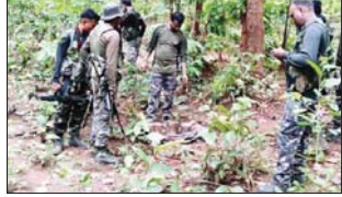
नारायणपुर,30 अप्रैल छत्तीसगढ़-महाराष्ट्र बॉर्डर पर पुलिस और नक्सलियों के बीच हुई मुठभेड़ में 9 नक्सली मारे गए।

एके-47 सहित भारी मात्रा में हथियार व विस्फोटक जवा