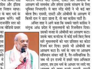
रायपुर,30 अप्रैल राज्य के आरक्षण को खत्म करने के लिए भूमिका निभाएंगे।

भारतीय जनता पार्टी एसीसी, एसीसी और ओबीसी के आरक्षण को समाप्त करने की मांग करेगी।