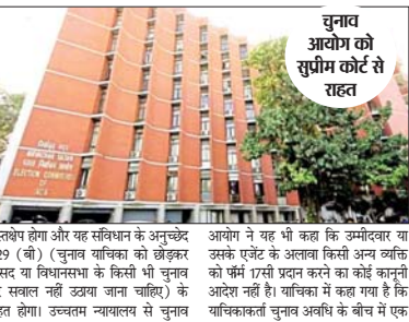
चुनाव आयोग को सुप्रीम कोर्ट से रहत

दखलबाज होगा और यह संविधान के अनुच्छेद 329 (बी) (चुनाव याचिका को अंडरकर संसद या विधानसभा के किसी भी चुनाव पर सवाल नहीं उठाना जाना चाहिए) के तहत होगा। उच्चतम न्यायालय से चुनाव