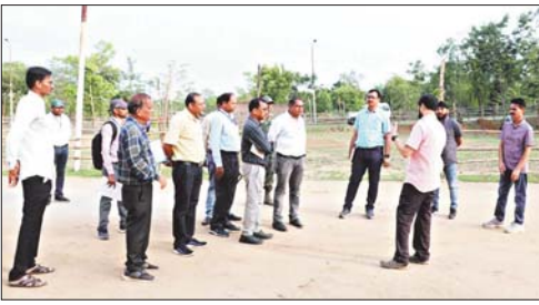
उपस्थित अधिकारियों को दिए। गमी के मौसम को दृष्टिगत करते हुए पत्रांगन में कूलर और

उत्तर बस्तर कांकिर, 24 मई। लोकसभा आभियान-2024 के अंतर्गत कलेक्टर एवं जिला निर्वाचन अधिकारी श्री अभिजीत सिंह ने आज ग्राम नाथियनगाव के पॉलिटेक्निक स्थित मतगणना स्थल का निरीक्षण कर प्रत्येक व्यवस्था की सूचना से जानकारी ली और अधिकारियों को आवश्यक निर्देश दिए।