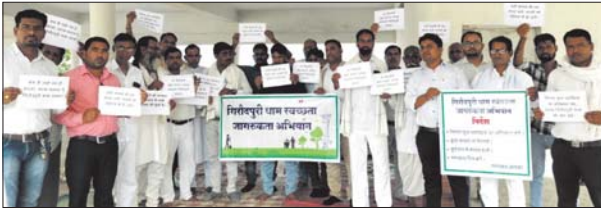
एवं कचरा फैलाने वालों पर नजर रखने निवेदन किया गया। जोमदी को स्वच्छ रखने एवं प्वावरण संरक्षण के लिए अलोक किया गया।

बलौदाबाजार, 24 मई। गिरौदपुरी धाम स्वच्छता मित्र टीम के द्वारा गिरौदपुरी धाम में स्वच्छता अभियान चलाया गया। जिसमें प्रमुख रूप से भिलाई-दुर्ग, बिलासपुर, बलौदा बाजार, महासमुंद्र जिले से से 45-50 की संख्या में स्वच्छता मित्र दल गिरौदपुरी धाम पहुंचे। जिसमें मुख्य मंत्री परिसर एवं दर्शनार्थी शेड की साफ सफाई की गई। गिरौदपुरी धाम आने वाले श्रद्धालुओं को प्लास्टिक कचरा मुक्त गिरौदपुरी धाम बनाने का संकल्प कराया गया। वर्षों के व्यवसायियों को अपने दुकान के सामने अनिवासी रूप से डस्टबिन रखने