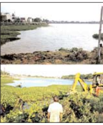
स्वच्छता अभियान चलाया गया। कोंडागाँव ब्लॉक में बांध तालाब पार्क के अंदर और बाहर झाड़ू लगाया गया और तालाब में से 18