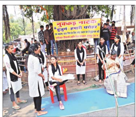
रापुर 15 मई। बुजुर्ग हमारी घरोंर नामक नुकड़ नाटक का आज प्रदर्शन किया गया। नाटक में संदेश दिया गया है कि घर के बुजुर्ग को कभी भी वृद्धाश्रम में न छोड़े। ये हमारी घरोंर है।

शारीरिक व बौद्धिक विकास के साथ ही सांस्कृतिक व नैतिक पर बल दिया जाता है। संस्कार के साथ अनुशासन भी विद्यार्थियों के ध्यान में रखा जाता है। योग्यता मुक्त शिक्षा व कोशल विकास शाला प्रबंधन की प्राथमिकताओं में शामिल है। यहां शिक्षक-विद्यार्थियों व अन्य स्टाफ विषय योग्यता वाली भी है। स्कूल पूर्ण सुविधाओं से युक्त है। सभी तो शर्ह के बच्चे कुछ बड़ा व स्वर्णिम भविष्य हासिल कर निकलते हैं।