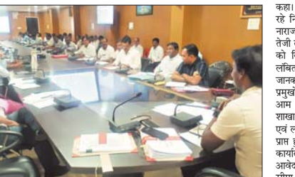
समय सीमा की बैठक में विभिन्न विभागों के कार्यों की समीक्षा की

बलौदाबाजार, 15 मई। कलेक्टर के एल चौहान ने संयुक्त जिला कार्यालय के सभागार में समय सीमा के तहत विभागीय कार्यों की काम काज की समीक्षा किए, जिसमें उन्होंने केंद्रीय योजनाओं की क्रियान्वयन से संबंधित जानकारी को विस्तृत समीक्षा करते हुए सर्वोच्च प्राथमिकता से पूर्ण करने के निर्देश संबंधित अधिकारियों को दिए हैं। उन्होंने कहा की अब अधिकारी कर्मचारी चुनौती मोड से बाहर आकर अपने अपने विभागों में चल रहे योजनाओं में तेजी लाएं। श्री चौहान ने शासन से प्राप्त निर्देश पर सभी स्कूलों में समर कैप लगाने के निर्देश लिखा शिशा अधिकारी को दिए हैं इसके लिए शीघ्र ही 2 दिनों में विस्तृत राड भेज बनाने कहा गया है। इसके साथ ही कलेक्टर ने आज सीमांकन के कार्य में तेजी लाने के निर्देश सभी एसडीएम को दिए हैं। उन्होंने दो टुक कहा की राजस्व