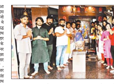
छत्तीसगढ़ की पहली डांस फिल्म नाचा में कई बड़े चेहरे शामिल

रायपुर 15 मई। फिल्म का मुहूर्त 12 मई को हुआ