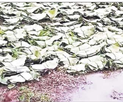
मिच्छले दिनों तेज अंधड़ के साथ बारिश हुई थी। कुछ जगहों पर ओलावृष्टि भी हुई थी, इसके कारण तेन्दुप्ता की गुणवत्ता पर प्रभाव पड़ा है।

जगदलपुर 14 मई। बस्तर संभाग के सभी जिलों बस्तर, कोडागढ़, दोटावाड़ा, सुकमा, कोकर, बीजापुर और नागपुर में मौसम विभाग ने आठ मई की रात से आठ मई की रात तक अंधड़ और बारिश की चेतावनी जारी करने का फैसला किया है।