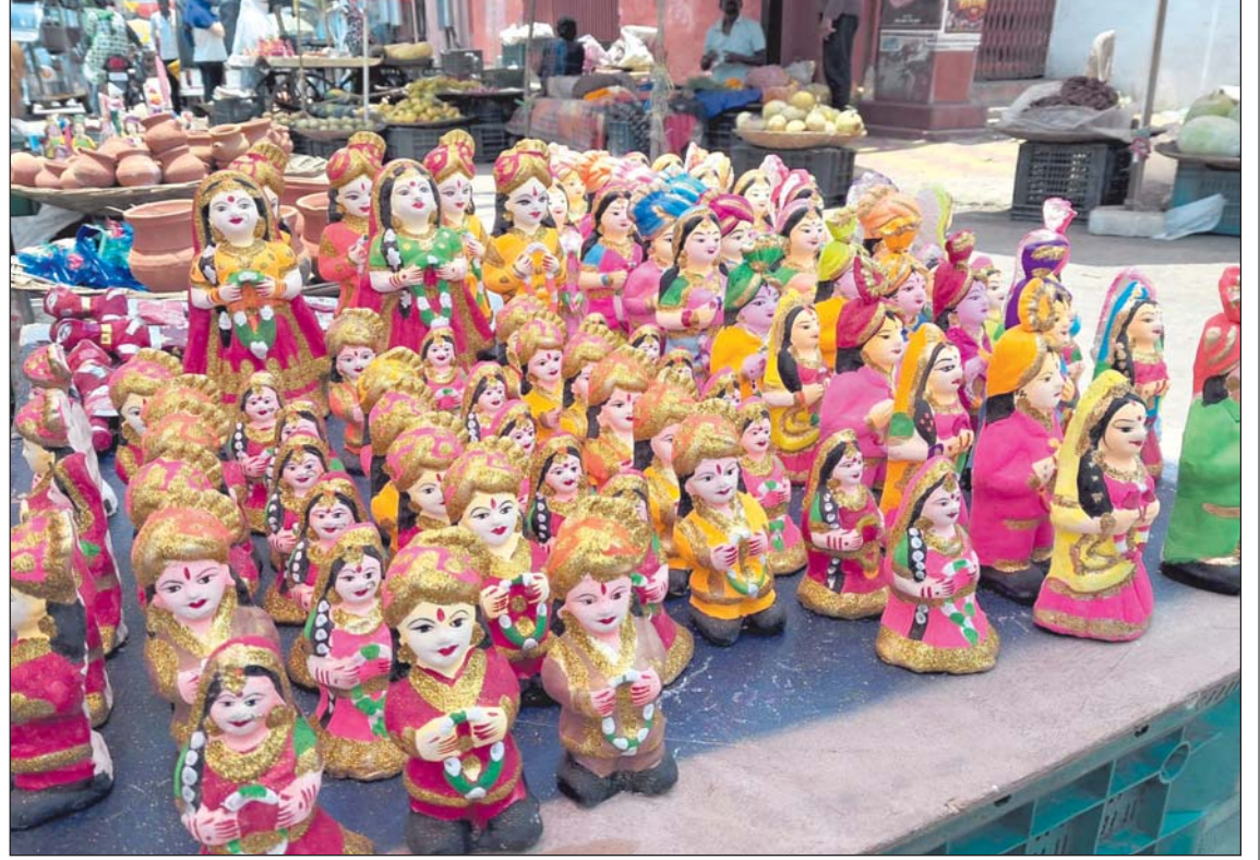
रायपुर, 9 मई। अक्षय तृतीया पर बच्चे घरों में विवाह मंडप बनाकर गुड़ड़ा-गुड़िया की शादी रचाएंगे। इसके लिए बाजारों में पुतरा-पुतरी की अच्छी बिक्री हो रही है।