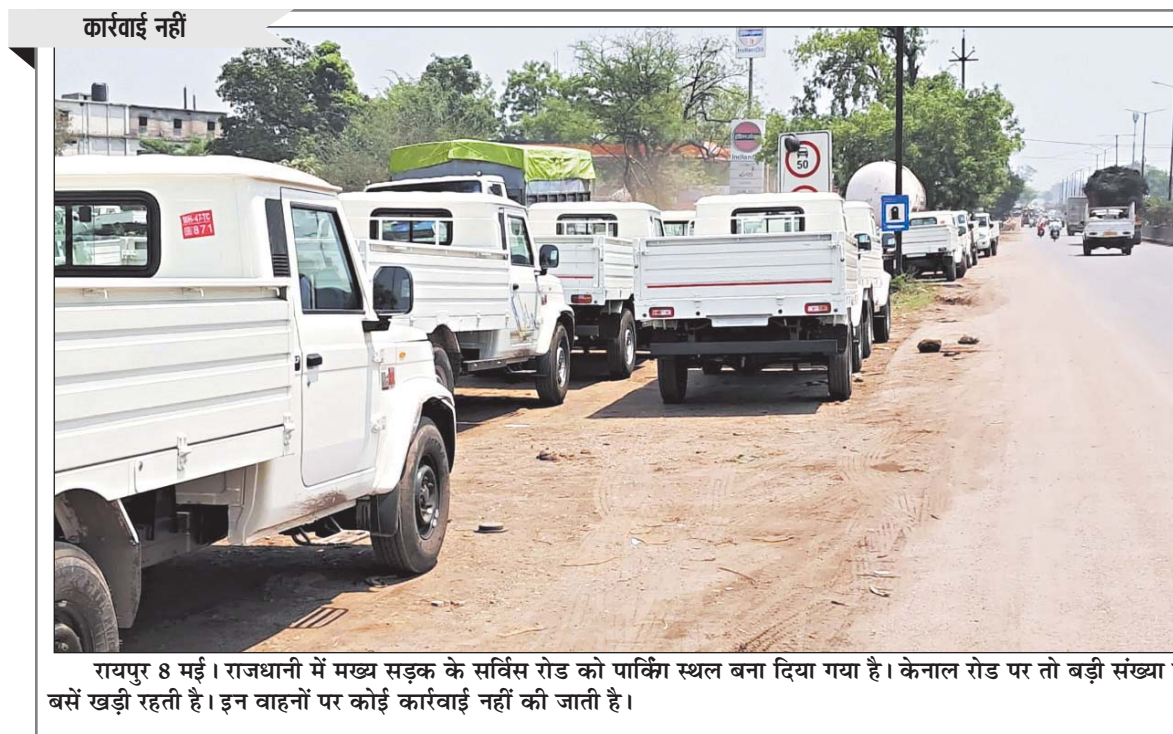
रायपुर 8 मई। राजधानी में मध्य सड़क के सर्विस रोड को पार्किंग स्थल बना दिया गया है। केनाल रोड पर तो बड़ी संख्या में बसें खड़ी रहती हैं। इन वाहनों पर कोई कार्रवाई नहीं की जाती है।