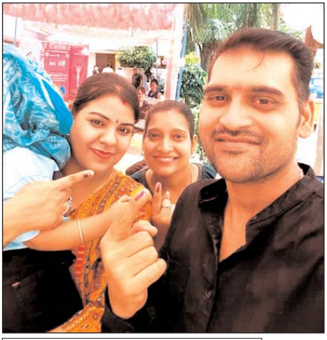
वरिष्ठ जन एवं दिव्यांगों को मिला मतदाता रथ का लाभ