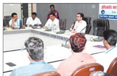
महत्वपूर्ण बताते हुए बहुत ही संवेदनशीलता एवं गंभीरतापूर्वक अपने दायित्वों का निर्वहन करने कहा। उन्होंने कहा कि आप सभी बिना किसी संशय से अपनी जिम्मेदारियों का गंभीरता से निर्वहन करें एवं प्रशिक्षण का लाभ लेते हुए अपने शंकाओं का समाधान प्राप्त करें। किसी प्रकार की शंका हो तो अपने उच्च अधिकारी से जानकारी लेकर शंका समाधान अवसर कर लें। प्रशिक्षण में मास्टर ट्रेनर द्वारा माइक्रो ऑब्जर्वर को प्रथम ट्रेनिंग में दी गई जानकारीयों का स्पष्टता करत हुए 18 विभिन्न विडियो में दी जाने वाली फ्रेमवर्क रिपोर्ट से अवगत कराया गया। साथ ही विभिन्न प्रश्नों की उपयोगिता वताकर संशोधित करने के संबंध में जानकारी दी गई। प्रशिक्षण में माइक्रो ऑब्जर्वर को मतदान स्थल पर तैयारी, ईवीएम, बैलेट यूनिट, मतदान दल के पीटमार्शन अधिकारी एवं अन्य मतदान अधिकारियों के कार्य, मतदान पत्नी, भाषण लेखना तथा मॉक पोल, वीओपीट में 50 बजे मॉक पोल करने की कार्यवाही के पक्षत सीआरसी, सीलिंग की कार्यवाही, ड्रक मॉशन, आदि प्रक्रिया के बारे में अवगत कराया गया एवं उनके शंकाओं का समाधान भी किया गया।