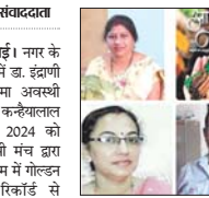
गया है। इसमें देश भर के प्रसिद्ध 127 साहित्यकारों द्वारा योग्य छंद के माध्यम से हिन्दी भाषा में विभिन्न आर्थिकयों की जानकारी दी गई है। साथ में भारत को जाने छंदक