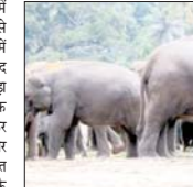
रही है। उपर कटघोरा वनमंडल के केंद्र व एतमानपर परिक्षेत्र में बड़ी संख्या में हाथियों की संकलना लगातार बनी हुई है जिससे ग्रामीणों को खतरा कायम है। यहां वन विभाग द्वारा हाथियों की निगरानी धर्मल डून के अंतर्गत कर रही है। इसके लिए विभागीय अधिकारियों एवं कर्मचारियों की बारी-बारी से ड्यूटी लगाई गई है जो मौके पर पहुंचकर हाथियों को निगरानी में जुटे रहते हैं। डीओफा कुरान शांति भी हाथियों की स्थिति पता लगाने रात में स्वयं जंगल की ओर निराल पड़ते हैं।

कोरबा, 5 मई। वनमंडल कोरबा के कुदमुरा रेंज में 36 हाथियों का दल फिर पहुंच गया है। धरमजगह क्षेत्र से धकेल हाथियों के इस दल ने रेंज अंतर्गत घुमा गांव व एक दर्जन ग्रामीणों के खेतों में लगे धान की फसल को रौंद दिया है। जिससे संबंधितों को काफी नुकसान उठाना पड़ा है। हाथियों के इस दल में 7 नर, 20 मादा तथा 9 शबक शामिल हैं, जिसमें क्षेत्र में आते ही उजवाट मचाना शुरू कर दिया है। हाथियों के इस दल के स्प्रेग व हिमकेटा को ओर आगे बढ़ने की संभावना है। जिसे देखते हुए संबंधित अमले को सतर्क कर दिया गया है। एक अनुमान के मुताबिक हाथियों के ताजा उजवाट में ग्रामीणों को हजारों रुपए की चपत लगी है। इन अमला द्वारा इस्का अंकलन कर रिपोर्ट तैयार की जा रही है जिसे मुआजजा स्वीकृत के लिए वरिष्ठ अधिकारियों को सोपा जाएगा। वन विभाग की ओर से वन प्राणियों द्वारा प्रसंचित को नुकसान पहुंचा जाने पर उसकी भरपाई के लिए पीड़ितों को मुआजजा दिए जाने का प्रावधान है। भुमगा क्षेत्र में बड़ी संख्या में हाथियों के विचरण करने से ग्रामीणों में भय का वातावरण है। हालांकि वन विभाग द्वारा हाथियों को गहन निगरानी की जा