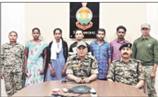
आत्मसमर्पण किया है। आत्मसमर्पण नक्सली थाना भेजी, किटाराम एवं पोडामरुई क्षेत्र के निवासी हैं। इन नक्सलियों को आत्म समर्पण हेतु प्रोत्साहित करने में सुकमा डीआरजी टीम गौरव, विशेष आसूचना शाखा जिला सुकमा, रेंज फिस्ट टीम सीआरपीएफ सुकमा

जगदलपुर 2 मई। पुलिस और सुरक्षा बलों के बढ़ते दबाव से जहां बस्तर संभाग में सक्रिय नक्सलियों के हाथ पड़ते जा रहे हैं, वहीं राज्य सरकार को पूर्ववर्त नीति का भी सकारात्मक असर दिखने लगा है। गामस की नीति से प्रभावित हो नक्सली आग समर्पण कर समाज की सुखशान्ता से फिर से जुड़ने लगे हैं। बस्तर संभाग के सुकमा जिले में तो नक्सलियों के आत्मसमर्पण का सिंसांलित हो चल पड़ा है। सुकमा जिले में फिर एक एक लाख रुपए की इनामी दो महिला नक्सलियों समेत पांच नक्सलियों ने आत्म समर्पण किया है। छत्तीसगढ़ नक्सलवाद उन्मूलन नीति तथा सुकमा पुलिस द्वारा चलाया जा रहे पूना नकोम अभियान (नई सुबह-नई सुरक्षा) से प्रभावित होकर एक अंदरूनी क्षेत्रों में लगातार सुरक्षा बलों के कैच स्थापित होने के चलते इन नक्सलियों ने