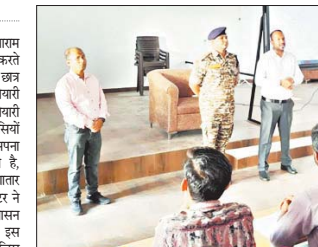
की जा सकती है। सफलता के लिए सतत प्रयास जरूरी है। यदि असफल भी हो तो निराशा न है, असफलता ही हमें बस्तर जिले के अलगाव अन्न जयदी की जिलों से भी बच्चे पढ़ाई करने पहुंचे है।