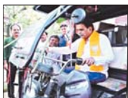
जीत दिलाने का संकल्प लेकर रायपुर लोकसभा कटर