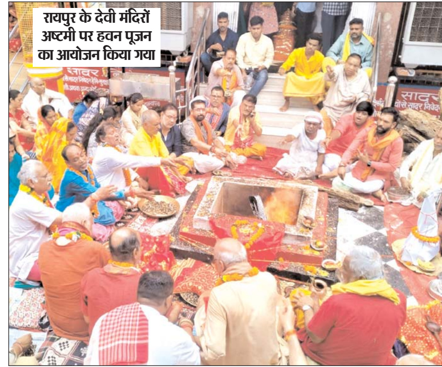
रायपुर के देवी मंदिरों अष्टमी पर हवन पूजन का आयोजन किया गया

तक का मुफ्त इलाज मिलेगा, ये मोदी की गारंटी है। किसान सम्मान निधि आगे भी जारी रहेगी, ये मोदी की गारंटी है। उन्होंने कहा कि बीते 10 साल में देश में एक ऐसी क्रांति आई है, जिसकी जतनी चर्चा नहीं होती। ये क्रांति देश के महिला स्वयं सहायता समूहों द्वारा की गई है। पिछले 10 साल में 10 करोड़ महिलाएं सम्पन्न गंवा दिया। उन्होंने कहा कि 25 करोड़ देशवासियों को आपके इस सेवक ने गरीबी से बाहर निकाला है। दशकों तक गरीबों को रोटी, मकान के सपने दिखाए कांग्रेस और उनके साथियों ने। लेकिन, 4 करोड़ गरीबों को पक्के मकान दिए एनडीए सरकार ने। प्रधानमंत्री ने कहा कि दलित, वंचित और