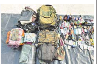
बीजापुर 7 अप्रैल। तटण में प्रातः लगभग 5:30 बजे जिला बीजापुर के थाना उच्च क्षेत्रांतर्गत तेरगाणा-पुत्रीसरगढ़ सीमा पर डोनांगुलु के जंगलों में सुरक्षा बल और माओवादीओं के बीच मुठभेड़ हुई। मुठभेड़ प्रचालित पटना स्थल की संचिक करने पर पटना स्थल से 03 माओवादीयों के शव एवं 01 एलएमजी, 01 एकै-47 समेत कई हथियार बरामद किया गया है।