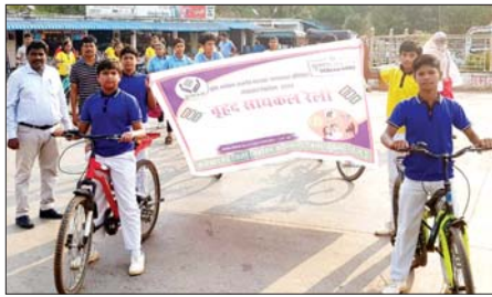
में बैर पोस्टर लेकर नारा की गुंज के साथ बस्तर-आम नागरिकों मतदाता जागरूकता का संदेश देकर मतदान करने के लिए प्रेरित किया।