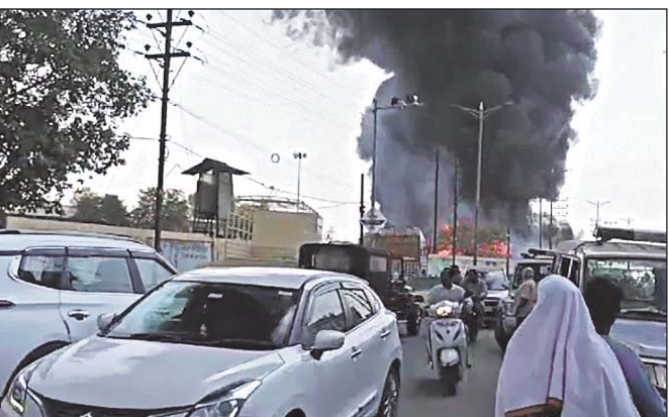
रायपुर 5 अप्रैल। राजधानी रायपुर स्थित भारत माता चौक के पास बिजली विभाग के सब डिवीजन दफ्तर के पास स्थित यार्ड में आज दोपहर भीषण आग लग गई है। इसकी सूचना मिलते ही दमकल की 6 गाड़ियां मौके पर पहुंची और आग बुझाने में जुट गई है।