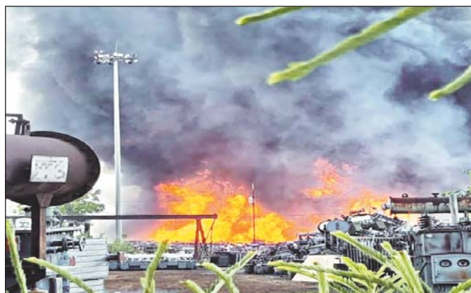
ब्लास्ट भी हो रहे हैं। यार्ड में हजारों लीटर आइल भी रखा हुआ था। इसमें भी आग लगने के कारण स्थिति खतरनाक हो गई। धुआं कई किलोमीटर दूर तक नजर आ रहा था। आसपास के इलाकों में दहशत का माहौल बन गया था।