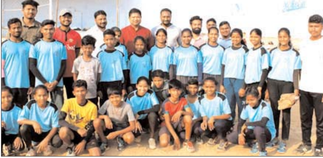
तरुण छत्तीसगढ़ संवाददाता