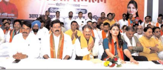
रत्न छत्तीसगढ़ संवाददाता