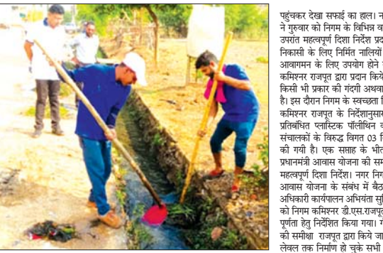
भिलाई, 22 मार्च। बाजार चौक भिलाई-03 एवं शांति नगर वार्ड में सैट्टी होने वाली सफाई व्यवस्था का निगम कमिश्नर ने किया निरीक्षण। विश्व बैंक कालोनी में भी स्वच्छ