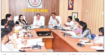
उन्होंने आदर्श आचार संहिता का उल्लंघन होने पर संबंधितों को नोटिस जारी करने के निर्देश दिए। सभी सहायक रिटर्निंग अधिकारी एवं अन्य नोडल अधिकारी सक्रियतापूर्वक कार्य करेंगे। निर्वाचन