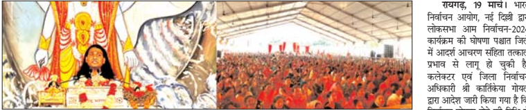
तृण छत्तीसगढ़ संवाददाता