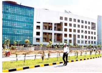
जिला से लेकर संचालनालय तक बिल के देयकों के लिए लगी कतार

रायपुर, 7 मार्च। अंतिम वित्तीय माह में वित्त विभाग ने विभिन्न विभागों के शीर्ष मद (हेड अकाउंट) में धनराशि का स्थानांतरण करने के लिए सर्वर का लॉक 15 मार्च तक खोल दिया है। सरकार के लोक निर्माण, सिंचाई, वन विभाग, पंचायत सहित अन्य विभागों द्वारा करोड़ों की राशि अंतरित की जा रही है। इधर जिला कोषालयों में भी मार्च अंतिम वित्तीय माह होने के कारण बड़ी संख्या में बिल लगाए गए हैं। एक अनुमान के अनुसार 100 करोड़ से भी अधिक की राशि शासकीय मदों से निकाली जाएगी।