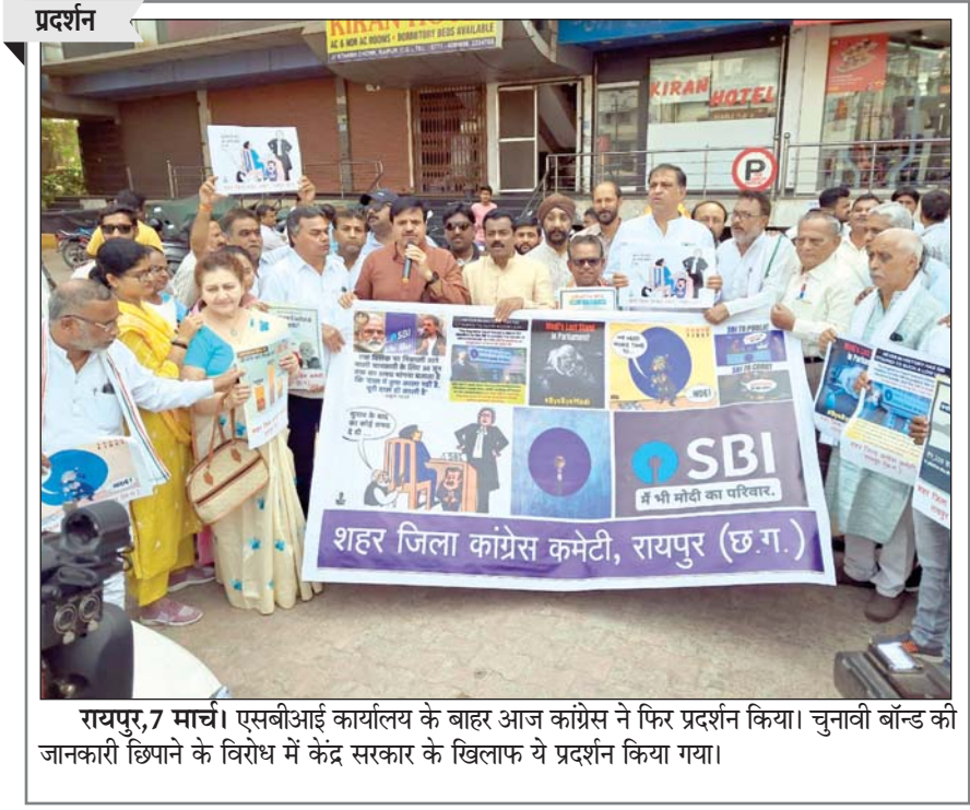
रायपुर, 7 मार्च। एसबीआई कार्यालय के बाहर आज कांग्रेस ने फिर प्रदर्शन किया। चुनावी बॉन्ड की जानकारी छिपाने के विरोध में केंद्र सरकार के खिलाफ ये प्रदर्शन किया गया।

खरीदी-बिक्री बंद कर दी गई थी लेकिन विस सत्र होने के कारण अब शीर्ष मद का सर्वर लॉक खोल दिया गया है ताकि सभी विभाग अपने-अपने देयकों को पूर्ण कर सकें। नए नियम के अनुसार यह राशि लैप्स नहीं होती है लेकिन अगले बजट में इसे समायोजित कर दिया जाता है। इसे निकालने में भारी परेशानी होती है। वित्त विभाग के समक्ष इस समय लोक निर्माण, सिंचाई, वन तथा अन्य विभागों ने एक बड़ी राशि अंतरित करने के लिए पत्र लिखा है। वर्तमान में 35 से अधिक जिला कोषालय हैं। यहां पर भी बड़ी संख्या में बिल लगाए गए हैं। स्वास्थ्य, पंचायत, आदिम जाति विभाग में केंद्र प्रवर्तित योजनाओं की राशि निकालने के लिए भारी प्रयास किए जा रहे हैं। शासकीय कार्यालयों में इस समय बिल लगाकर इसे पारित करने का खेल चल रहा है। अंतिम वित्तीय माह होने के कारण कोषालयों में भी विभिन्न शीर्ष मदों से राशि निकालने के लिए उठापटक चल रही है। समझा जाता है कि स्टेट बैंक सहित अन्य राष्ट्रीयकृत बैंकों से जमा राशि निकालने के लिए भी उच्च स्तरीय प्रयास किए जा रहे हैं।