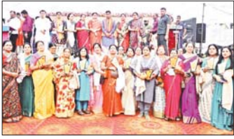
रायपुर के ओर से सरसकत नारी समागम का आयोजन किया गया। नेवरा के बीबीजी स्कूल परिसर में तिलदा क्षेत्र के दो हजार से अधिक महिलाओं ने कार्यक्रम में सहभागिता दी। इस

तिलदा-नेवरा 6 मार्च। राजधानी के विकासखण्ड तिलदा-नेवरा में आयोजित सरसकत नारी समागम में मंत्री टंकाम वर्मा का अनेकधा अंदाज देखने को मिला। आयोजन में पहुंचते ही मंत्री वर्मा मंच में आकर दरलक दीर्घा में बैठे। सभी महिलाओं से सीधा मुलाक़ात किए और सभी महिलाओं का हाल चाल जाना। मंत्री वर्मा के अपनत्व की भावना को देखकर महिलाओं ने कहा कि मंत्री होने के बावजूद पारिवारिक सदस्य के रूप में मंत्री वर्मा हमारे बीच मौजूद रहते हैं। सभी का कुशलबख्त जानते हैं। हमें मंत्री टंकाम वर्मा बड़े भाई की तरह लगते हैं। विहित हो कि 8 मार्च को अंतरराष्ट्रीय महिला दिवस है। इस उपलक्ष्य में 2 दिन पूर्व तिलदा में जिला शासन