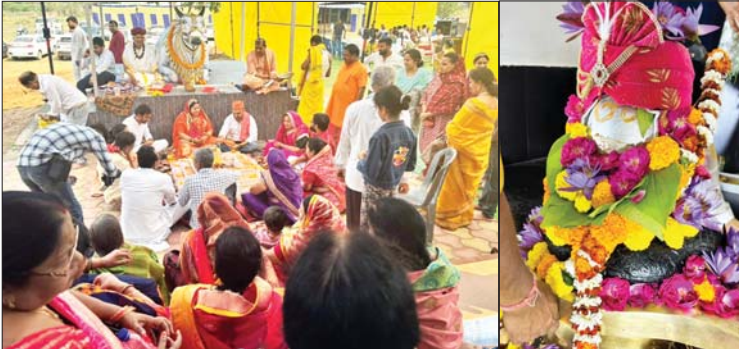
रायपुर, 6 मार्च ■ तरुण छत्तीसगढ़

विधि-विधान व मंत्रोच्चार के साथ पारा निर्मित शिवलिंग की प्रतिष्ठा, शिवधाम में अद्भुत, अनुपम व अद्वितीय नजारा