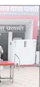
पुलिस थाना पतारी

शराब बिक्री करने वाले एक शराब कोचिया को गिरफ्तार किया गया। आरोपी से 3520 कीमत मूल्य का 32 पाव देशी मीटरा शराब कुल 5.76 बल्क लीटर शराब जब्त किया गया है। आरोपी के विरुद्ध थाना पतारी में अपराध क्र.153 /2024 धारा 34(2) आबाकारी एक्ट के तहत अपराध पंजीबकद कार आपी को जेल भेजने की प्रक्रिया की जा रही है।