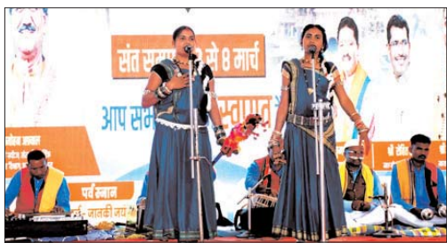
जाराता में देवी के भजन तोला बंद... तोला दुर्गा कवच की काली... मोर गांव में के शैलता दक्षिण भिन्न से नवरात्र के माहेल बनाए।

राजिम, 2 मार्च। राजिम कुंभ के सांस्कृतिक मंच में प्रतिदिन कलाकारों द्वारा उच्च दर्ज प्रदर्शन कर दर्शकों का भरपूर मनोरंजन कर रहे हैं। प्रदेश के विभिन्न जगहों से पहुंचे कलाकार अपनी माटी की सीधी महक को दूर तक बिखेर रहे हैं। आज सातवें दिन श्री कुलेश्वर महोदय मंदिर के समीप बने मंच पर एक से बढ़कर एक प्रस्तुति ने मन मोह लिया।