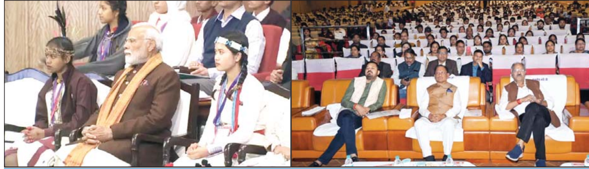
परीक्षा पे चर्चा: बस्तर के छात्र के सवाल पर मोदी का जवाब