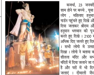
कवर्धा, 23 जनवरी। शाम होने पर बच्चे, युवा, लोग, महिलाएं हनुमान गार्डन पहुंचते हुए दिवा और दिया जलाकर श्रीराम और हनुमान भगवान की पूजा करते हुए दिवा। 2100 से अधिक दिए जलते हुए दिखे। सभी लोगों ने उत्साह दिखा। लोगों ने बताया की शौतला मंदिर और सभी मंदिरों में दिया जलाने जा रहे है और चोरों में भी दिया जलाए। दीवाली जैसा माहौल दिखा पड़ेगा।