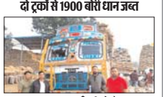
दो ट्रकों से 1900 बोरी धान जल