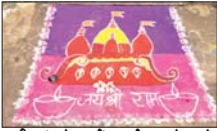
महिलाएं अयोध्या नहीं जा सकी पर घर के सामने रोली से मंदिर बना दीप जला पूजा की