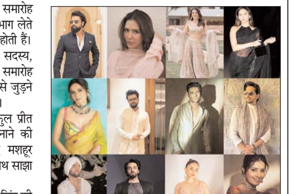
चेहरा सोनम बाजवा का लोहड़ी से गहरा नाता है। चूँकि त्योहार यहाँ है, वह पारंपरिक अनुष्ठानों में भाग ले सकती हैं, जिसमें परंपरा के साथ ग्लैमर का मिश्रण होगा।

पुलकित सम्राट: दिल्ली के रहने वाले पुलकित सम्राट ने अपने करिश्माई अभिनय से फिल्म इंडस्ट्री में अपनी पहचान बनाई है। इस लोहड़ी पर हमारे 'हमी' के अपनी पंजाबी पृष्ठभूमि का सम्मान करते हुए पारंपरिक उत्साह के साथ उत्सव में शामिल होने की संभावना है। मनीष पॉल: बहुमुखी अभिनेता, जो अपनी संक्रामक