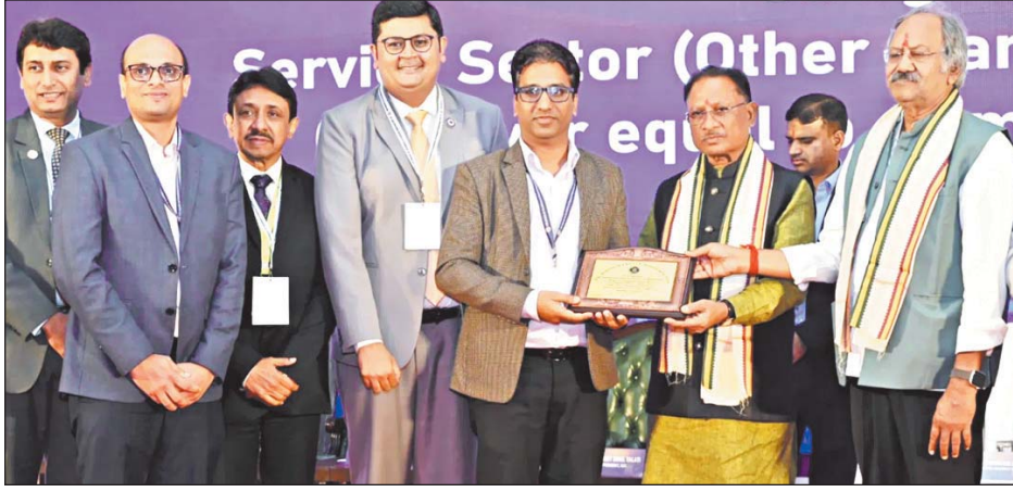
सेवा प्रदाता कंपनियों की बड़ी भागीदारी होगी। उन्होंने कहा कि वर्तमान में हम दुनिया की को भी अधिक रूप से मजबूती देना। उन्होंने

मुख्यमंत्री श्री विष्णु देव साय ने पुरस्कार प्राप्त करने वाले संस्थाओं को बधाई देते हुए कहा कि 2047 तक भारत को दुनिया की तीसरी सबसे बड़ी अर्थव्यवस्था बनाने के प्रधानमंत्री श्री नरेंद्र मोदी जी के संकल्प को पूरा करने में सभी वित्तीय, गैर वित्तीय, उद्योग और