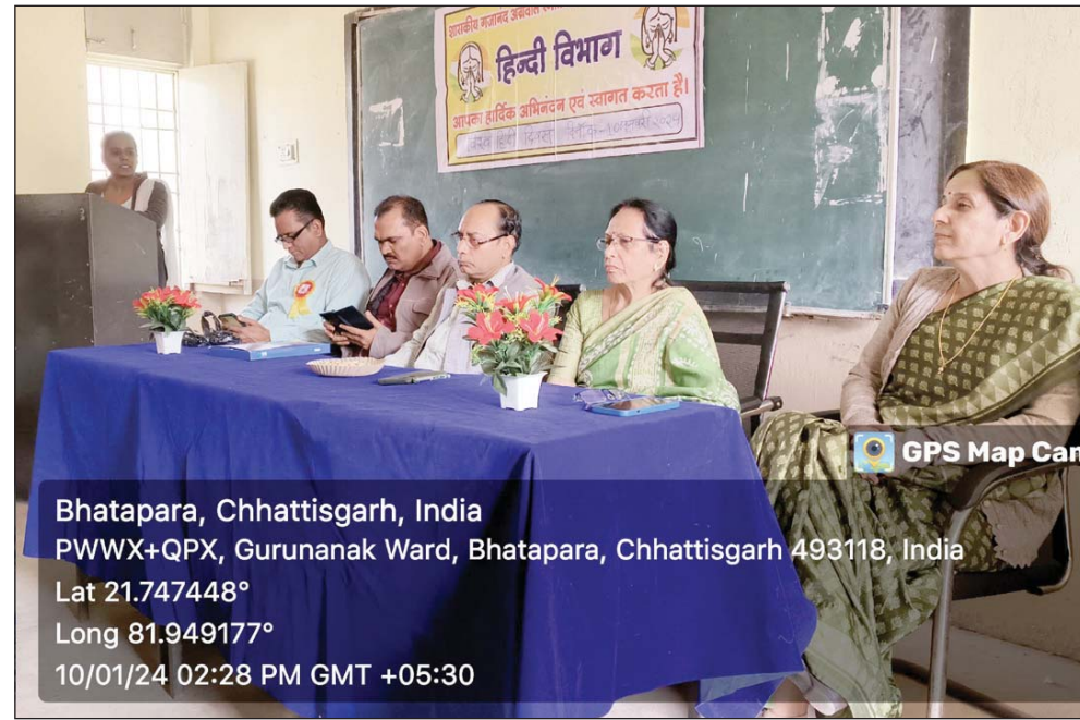
Bhatapara, Chhattisgarh, India PWXX+QPX, Gurunanak Ward, Bhatapara, Chhattisgarh 493118, India Lat 21.747448° Long 81.949177° 10/01/24 02:28 PM GMT +05:30