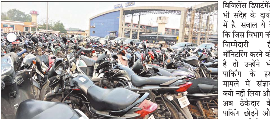
रायपुर रेल मंडल के जिम्मेदार रेल अधिकारी सबकुछ जानकर भी अंजान बनते रहे और ठेकेदार को बकाया राशि धीरे-धीरे 30 से 35 लाख के करीब पहुंच गई। रेलवे अधिकारी ठेकेदार को नोटिस देते रहे और उसके बाद भी कोई कार्रवाई नहीं हुई। रेलवे ने टर्मिनेशन की कार्रवाई आगे

बढ़ाई और पार्किंग रेलवे ने खुद चलानी शुरू की। अब सवाल ये है कि जब लाइसेंस फीस डिपॉजिट अमाउंट से 19 लाख रुपए अधिक तक चली गई तब भी ठेकेदार को रेलवे अधिकारियों ने पार्किंग चलाने क्यों दिया ? इस पूरे मामले में रेलवे का