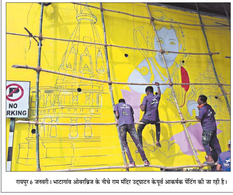
रायपुर 6 जनवरी। भाटागांव ओवरब्रिज के नीचे राम मंदिर उद्घाटन के पूर्व आकर्षक पेंटिंग की जा रही है।

मंत्रिमण्डल विस्तार एवं विभागों के वितरण के पश्चात आईएसएस अधिकारियों की भी पदस्थापना कर दी गई है। सूत्रों के अनुसार संघ के एक वरिष्ठ पदाधिकारी से इस समय मिलने-जुलने का सिलसिला जारी है। संगठन से सहमति मिलने के बाद ही अधिकारियों को नियुक्त किया जाएगा। सूत्रों के अनुसार साफ सुथरे छवि वालों को ही विशेष एवं निज सहायक बनाया जाएगा।