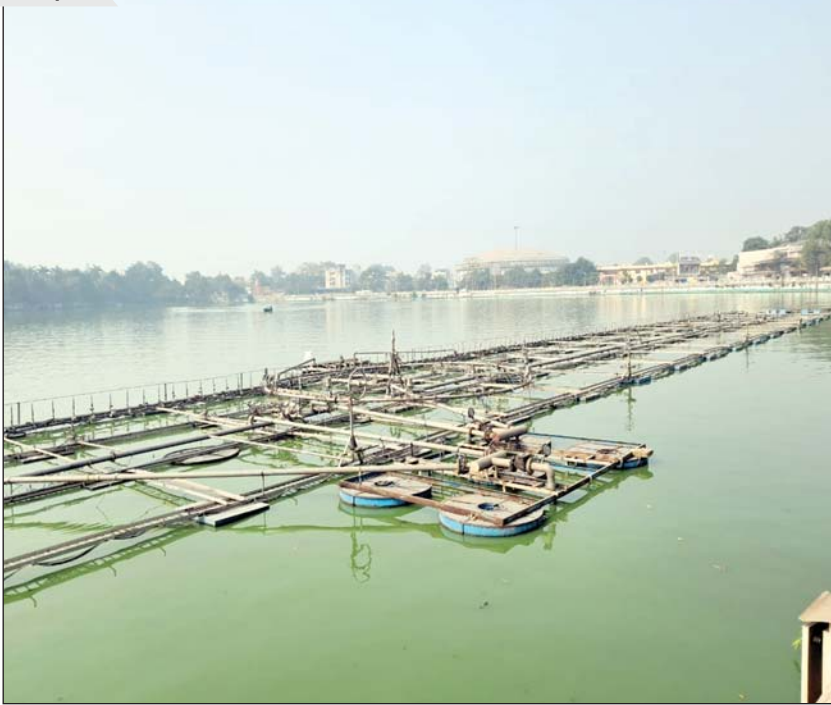
रायपुर, 4 जनवरी। बृहदातालाब में लगाया गया फ्लोटिंग फौव्वारा रखरखाव के अभाव में कबाड़ हो गया है।