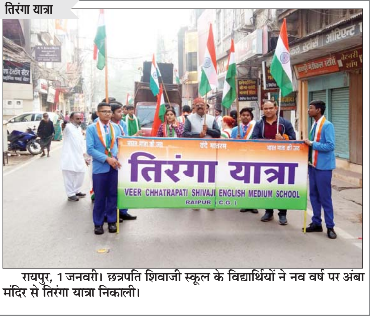
रायपुर, 1 जनवरी। छत्रपति शिवाजी स्कूल के विद्यार्थियों ने नव वर्ष पर अंबा मंदिर से तिरंगा यात्रा निकाली।

भाषण का जोर नहीं चला। हिमाचल भी पहाड़ी राज्य होने के कारण वहां भी उनका भाषण नहीं चला। छत्तीसगढ़, राजस्थान व म.प्र. हिन्दी भाषा होने के कारण मोदी का जादू चल गया। राजेन्द्र तिवारी ऐसे वक्ता है जो लोकसभा चुनाव में अपनी भाषण कला से मोदी को टक्कर दे सकते हैं। तिवारी कन्हैया कुमार से भी अच्छे वक्ता हैं। अतः आग्रह है तीनों नेताओं की नियुक्ति शीघ्र करे ताकि इनके नेतृत्व का लाभ कांग्रेस को मिल सके। सभी राज्यों में राष्ट्रीय स्तर के दो या तीन पदाधिकारी नियुक्त करना आवश्यक है।