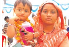
सुभद्रा को भिला प्रधानमंत्री मातृ वंदना योजना का लाभ

इस दौरान शिविर आयोजन वाले गांवों में स्वास्थ्य विभाग द्वारा मेडिकल कैंप लगाकर शिविर में आए 29 हजार 15 लोगों का स्वास्थ्य जांच की गई। जहां टीबी, गैर संचारी रोग, मधुमेह, सिकल सेल की स्क्रिनिंग की गई। प्रधानमंत्री सुरक्षित मातृत्व अभियान के तहत गर्भवती महिलाओं की जांच कर दवाइयां दी गईं।