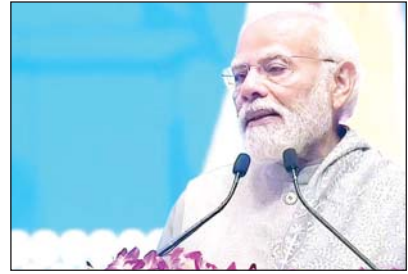
हमें याद दिलाता है कि शौर्य की पराकाष्ठा के समय कम आयु मायने नहीं रखती। प्रधानमंत्री ने कहा कि

साहस दिखाने की बात आती है तो उम्र मायने नहीं रखती।' मोदी ने कहा कि आज देश वीर साहिबजादों के अमर बलिदान को याद कर रहा है, उनसे प्रेरणा ले रहा है। आजादी के अमृतकाल में 'वीर बाल दिवस' के रूप में एक नया अध्याय प्रारंभ हुआ है। उन्होंने कहा कि पिछले वर्ष देश ने पहली बार 26 दिसंबर को वीर बाल दिवस के तौर पर मनाया था। तब पूरे देश में सभी ने भाव विभोर होकर साहिबजादों की वीर गाथाओं को सुना था। वीर बाल दिवस भारतीयता की रक्षा के लिए कुछ भी कर गुजरने के संकल्प का प्रतीक है। ये दिन