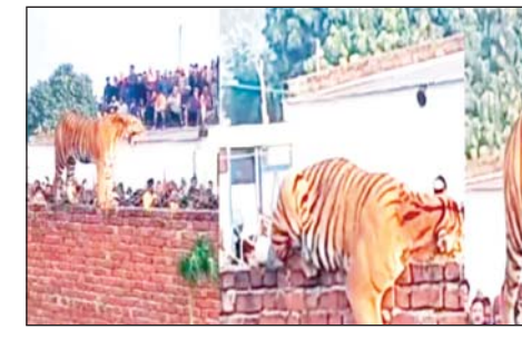
एंगिल से उसका वीडियो बनाते रहे। यह बाघ देर रात पीलीभीत के कलीनगर तहसील क्षेत्र के अटकाना में घुस आया था। लोगों की उस पर नजर पड़ी तो एकनागरी होश उड़ गए। रात के करीब डेढ़-दो बजे रहे थे। बाघ की सूचना जाल में आग की तरह पूरे क्षेत्र में फैल गई। लोग सतर्क हो गए। इसी बीच किसी ने

पीलीभीत, 26 दिसंबर। यूपी के पीलीभीत में अक्सर बाघ बस्ती में घुस जाते हैं और आतंक फैल जाता है। लेकिन सोशल मीडिया पर वायरल हो रहे एक ताजा वीडियो में जो कुछ दिख रहा है उससे तो यही लग रहा है कि लोगों के दिलों से बाघ का डर निकल गया है और भीड़ को लेकर बाघ भी सहज नजर आने लगे हैं। इस वीडियो में एक बाघ छत और दीवार पर घूमकर देर तक पोज देते नजर आ रहा है। चारों तरफ मौजूद भीड़ लगातार अपने मोबाइल कैमरों के जरिए उसे वीडियो की शक्ल में कैद करने पर आमादा है। लोगों का कहना है कि बाघ करीब छह-सात घंटे तक रहियशी इलाके में यू ही घूमता रहा और लोग अलग-अलग