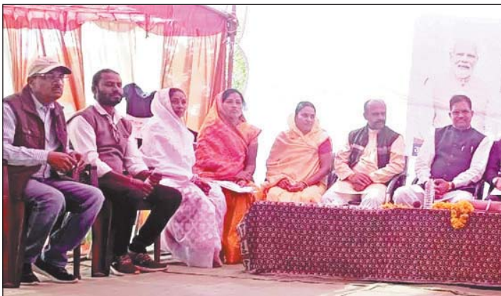
विकसित भारत के निर्माण के लिए शपथ दिलाई। उन्होंने जनसामान्य को अधिक से