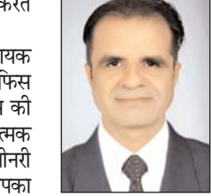
दिव्यांगजनों के अधिकार

दिसंबर 2023 को जारी किया है। यह कदम आयोग ने पहली बार उठाया है और कहल है कि राजनीतिक विमर्श/अभियान में दिव्यांगजनों को न्याय और सम्मान देना होगा, इसके साथ परामर्श भी जारी किए हैं कि हर राजनीतिक दल को अपने अनेक सेवाकार्यों निर्णय, नीतियों में दिव्यांगजनों को सहभागी बनाएं ताकि उनके जीवन में उत्साह सकारात्मक जीवन जीने का आभास नजर आए। आयोग ने एक विज्ञाि जारी कर कहा है कि राजनीतिक दलों और उनके प्रतिनिधियों को किसी भी सार्वजनिक सम्मगण, भाषण के दौरान, अपने लेखन, लेख आउटरजेन सामग्री, टीवी डिवेटे में या राजनीतिक अभियान में दिव्यांग जनों या दिव्यांगों पर गलत अपमानजनक, अपमानजनक संदर्भों का उपयोग नहीं करना चाहिए। हाल ही में, आयोग को राजनीतिक विमर्श में दिव्यांगजनों (पीडब्ल्यूडी) के बारे में अपमानजनक या आक्रामक भाषा के उपयोग के बारे में अगवत कराय़ा गया है। किसी भी राजनीतिक दल के सदस्यों या उनके उम्मीदवारों द्वारा भाषण/प्रचार-अभियान में इस तरह की भाषा का उपयोग दिव्यांगजनों के अपमान के रूप में समझा जा सकता है। समर्थनवादी या एबलिस्ट भाषा के सामान्य उदाहरण - गुंगा, पगल, सिरिपां अंधा, काना, बहरा, लंगड, लुला, अहाडिज आदि शब्द हैं। ऐसी अपमानजनक भाषा के उपयोग से बचना अत्यंत आवश्यक है। राजनीतिक विमर्श/अभियान में दिव्यांगजनों को आदर और सम्मान दिया जाना चाहिए।कृिक सभी समुदायोंके चुनावी प्रक्रियामें प्रतिनिधित्व में ही सही महीन में लोकतंत्र की बुनियाद निहित है इसलिए आज हम मीडिया में उपलब्ध जानकारी के सहयोग से इस आर्टिकल के माध्यम से चर्च करें राजनीतिक दल अपने सवादां भाषणों में दिव्यांगजनों के साथ सम्मानजनक तरीके से पेश आए, ऐसा चुनाव आयोग का फ़मान आया।