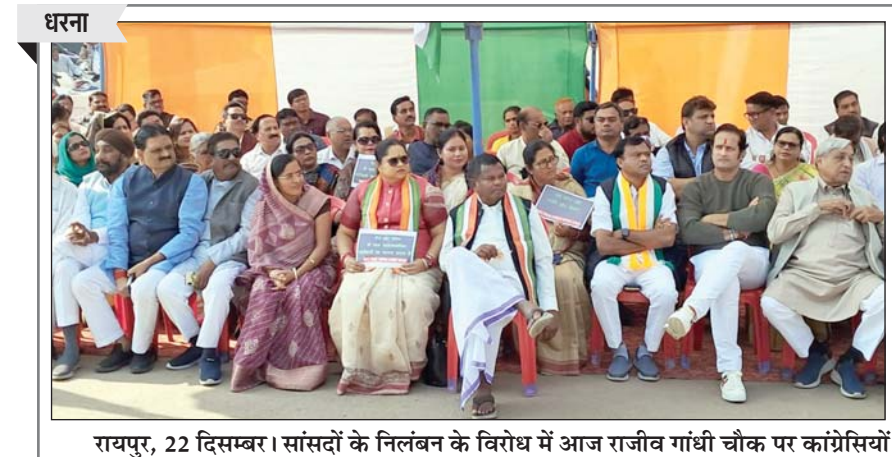
रायपुर, 22 दिसम्बर। सांसदों के निलंबन के विरोध में आज राजीव गांधी चौक पर कांग्रेसियों ने धरना दिया।