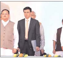
लेजर विधानसभा के समझ हुए प्रदर्शन के साथ ही भाजपा ने अपने धारदार तैवर दिखाए और उसके बाद लगातार चले अभियानों के कार्यक्रमों में भाजपा की भूमिका को प्रभावी बनाया।