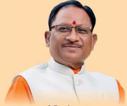
श्री विष्णु देव साय माननीय मुख्यमंत्री, छत्तीसगढ़