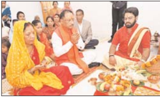
जगन्नाथ मंदिर में आरती