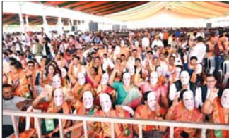
अटलजी को किया नमन