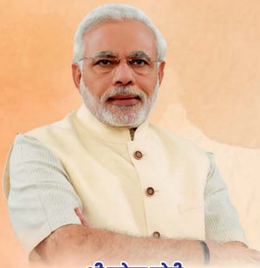
श्री नरेन्द्र मोदी