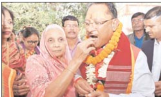
परिजनों के साथ अपने घर में ली पूजा