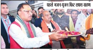
पहले गजान-पूजन फिर शपथ ग्रहण