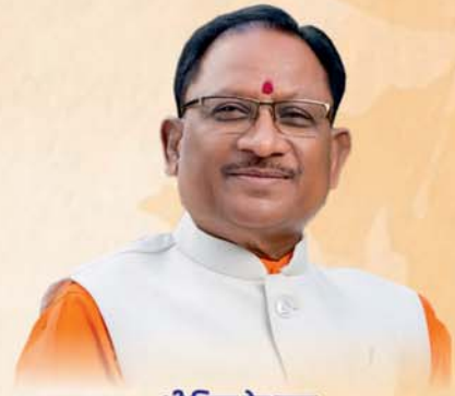
श्री विष्णु देव साय