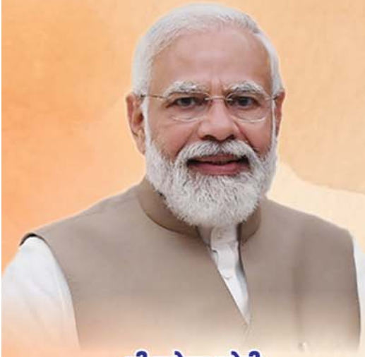
श्री नरेन्द्र मोदी