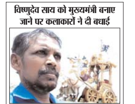
विष्णुदेव साय को मुख्यमंत्री बनाए जाने पर कलाकारों ने दी बधाई