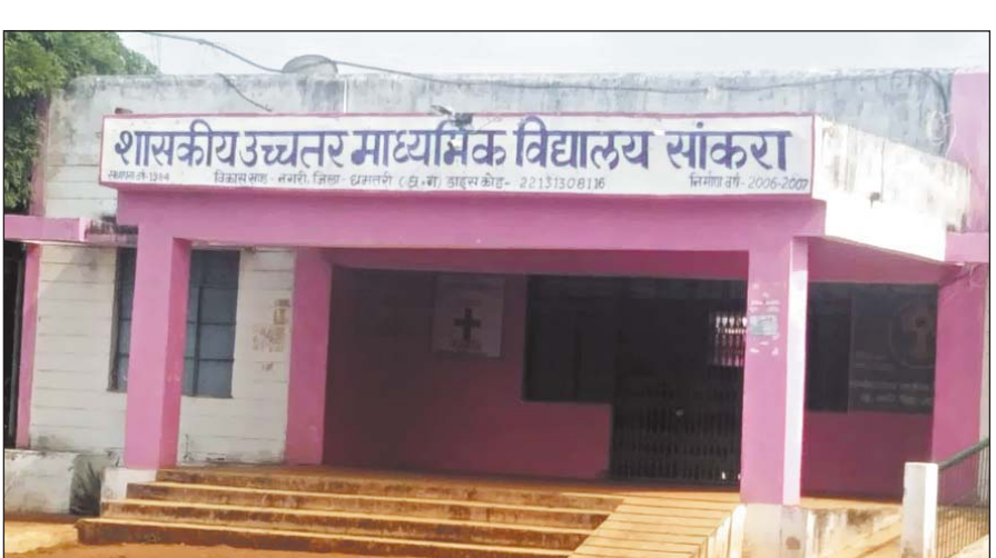
बाहर हैं,जनभागीदारी, विकास समिति, एवं क्रय अवैधानिक और नियमों के विरुद्ध है, प्राथमिक और माध्यमिक शिक्षा में भ्रष्टाचार नीति निर्माण और

रायपुर 11 दिसंबर। पं. रविशंकर शुक्ल विश्वविद्यालय में पीजी की सेमेस्टर परीक्षाएं इसी माह के आखिरी से शुरू होने जा रही हैं। यूनिवर्सिटी की ओर से जारी टाइम टेबल के मुताबिक एमए, एमएससी, एमबीए थर्ड सेमेस्टर की परीक्षा 29 दिसंबर से होगी। वहीं, प्रथम सेमेस्टर की परीक्षाएं 8 जनवरी से शुरू होंगी। एमएकट, बीएड, एमएड, एलएलएम, बीए एलएलबी समेत अन्य कक्षाओं की सेमेस्टर परीक्षाएं अलग-अलग तिथियों पर होंगी। परीक्षाएं पहली हाली यानी सुबह 11 से दोपहर 2 बजे के बीच होंगी। इस परीक्षा में 56 हजार से ज्यादा अभ्यर्थी हिस्सा लेंगे।