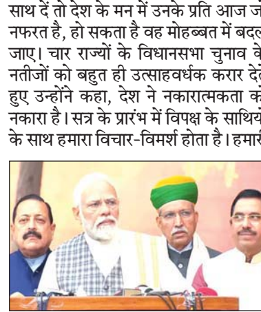
टीम उनसे चर्चा करती है। मिलाकर के सबके सहयोग के लिए हम हमेशा प्रार्थना करते हैं। इस बार भी इस प्रकार की सारी प्रक्रियाएं कर ली गई हैं। प्रधानमंत्री मोदी ने कहा, सार्वजनिक रूप से हमेशा हमारे सभी सांसदों से आग्रह करता हूँ कि लोकतंत्र का यह मंदिर जन आकांक्षाओं के लिए, विकासित भारत की नयी राह को अधिक मजबूत बनाने के लिए बहुत महत्वपूर्ण मंच है। मैं सभी सांसदों से आग्रह कर रहा हूँ कि वह ज्यदा से ज्यदा तैयारी करके आएँ तथा सदन में जो भी विधेयक रखे जाएँ, उन पर गहन चर्चा हो। उन्होंने कहा कि एक सांसद जब सुझाव देता है तो उसमें जमीनी अनुभव का उमर तत्व छोड़ दें और देश हित में सकारात्मक चीजों में

नई दिल्ली, 4 दिसंबर। तीन राज्यों में विधानसभा चुनावों की जीत से उत्साहित भाजपा के सांसदों ने आज संसद के शीतकालीन सत्र की शुरुआत के समय प्रधानमंत्री नरेंद्र मोदी का जोरदार स्वागत किया। लोकसभा की कार्यवाही शुरू होने पर जैसे ही प्रधानमंत्री सदन में आये तो कई केंद्रीय मंत्रियों सहित भाजपा के सांसद मोदी मोदी के नारे लगाने लगे। इससे पहले संसद भवन पहुँचने पर भाजपा अध्यक्ष जेपी नड्डा का भी पार्टी के सांसदों और केंद्रीय मंत्रियों ने स्वागत किया। इसके अलावा चुनावी राज्यों से संबंध रखने वाले सांसदों को अन्य सांसदों में जब भाजपा सांसद मोदी मोदी के नारे लगा रहे थे और तालियाँ बजा रहे थे तब अग्रिम पंक्ति में प्रधानमंत्री नरेंद्र मोदी, रक्षा मंत्री राजनाथ सिंह, गृह मंत्री अमित शाह, परिवहन मंत्री नितिन गडकरी शांत बैठे मुस्करा रहे थे। इससे पहले संसद भवन परिसर में मीडिया से बात करते हुए प्रधानमंत्री ने विपक्षी दलों से आग्रह किया कि संसद के शीतकालीन सत्र में वे, विधानसभा चुनावों में मिली पराजय का गुस्सा ना निकालें बल्कि उससे सीख लेते हुए नकारात्मकता को पीछे छोड़ें और सकारात्मक रुख के साथ आगे बढ़ें। सत्र के पहले दिन मीडिया को संबोधित करते हुए प्रधानमंत्री ने यह भी कहा कि यदि विपक्षी दल विरोध के लिए विरोध का तरीका छोड़ दें और देश हित में सकारात्मक चीजों में